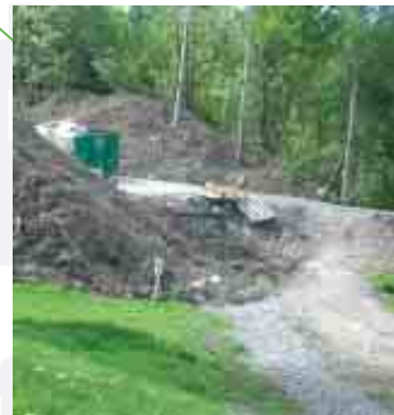
Nye veger og nye boligfelt kan ødelegge snarveger.