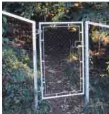
Ny eier setter opp porter.