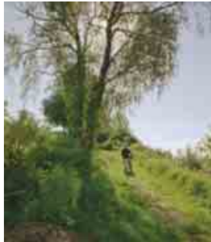
Snarveger kan gi naturopplevelser.