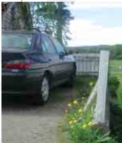
Her var det en god snarveg.