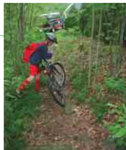
Her er såvidt framkommelig til fots og med sykkel.