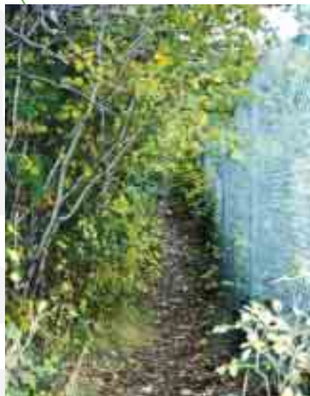
Gjerdet hører til en industritomt. Stien går over et restareal mellom to industritomter.