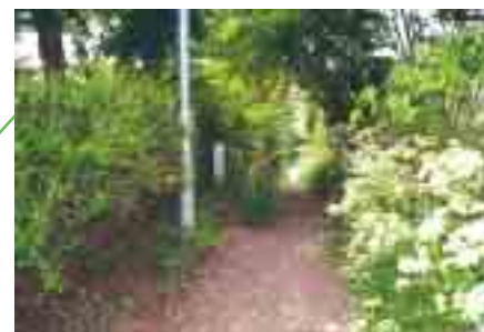
Snarveg som går langsmed inngjerdet boligfelt.