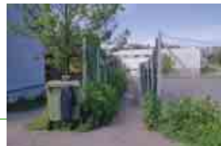
Snarvegen er regulert og tilrettelagt et stykke mellom to industritomter.