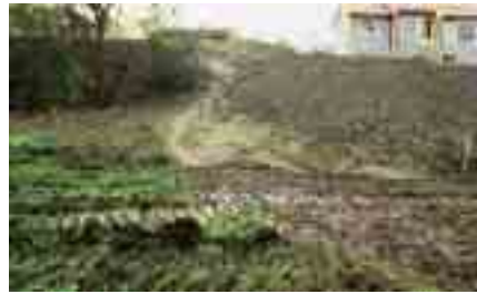
Selv når snarvegen er i så dårlig forfatning blir den brukt.