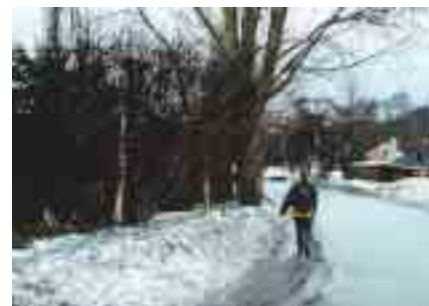
Når snarvegene mangler Når det ikke fins snarveger som alternativ, må fotgjengere ofte ta til takke med både farlige og utrivelige forhold.