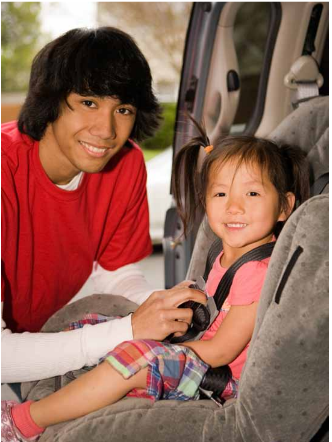
Buugan yarahan dabacaadiisa waxa kaalmeeyay shirkadaha igshooranka ee Norway. Oversatt ved Tolketjenesten i Oslo, februar 2010