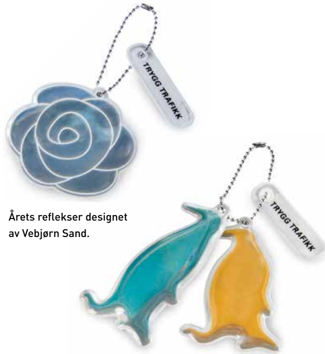
Årets reflekser designet av Vebjørn Sand.