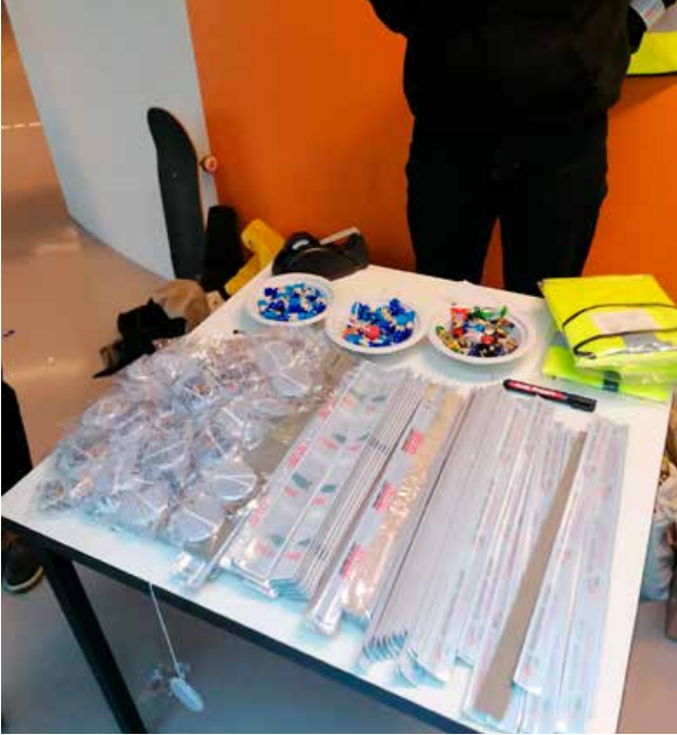
Trafikksikkerhetsambassadørene har hatt refleksaksjon på sin skole.