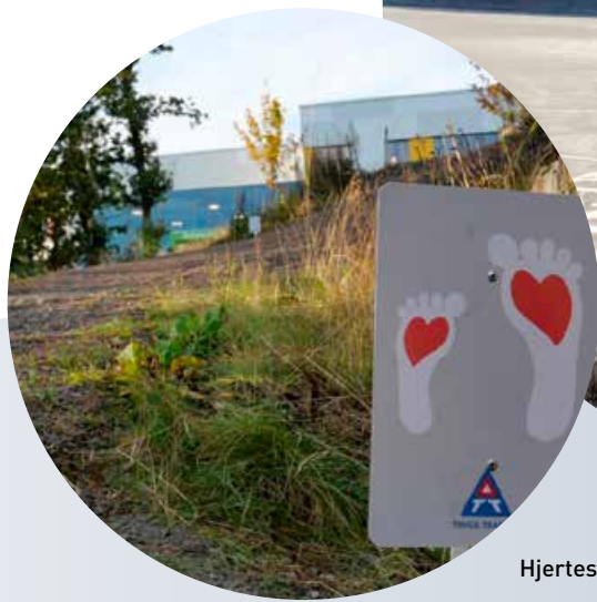
Hjertesone i Arendal.