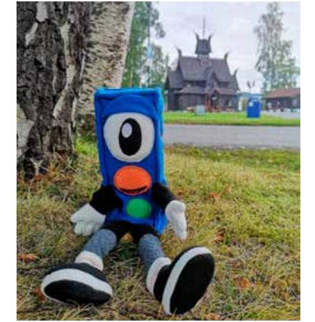
Lyset var selvfølgelig med, da det ble avholdt barnehagekurs på ærverdige Bårdshaug herrergård på Orkanger.

utfordringer. Men alle som har ønsket det, har fått bistand til å fokusere på trafikksikkerhet i forbindelse med slike møter. I tillegg har mange skoler benyttet seg av Trygg Trafikk sitt opplæringsmaterieill i forbindelse med trafikksikkerhetsopplæringen i skolene.