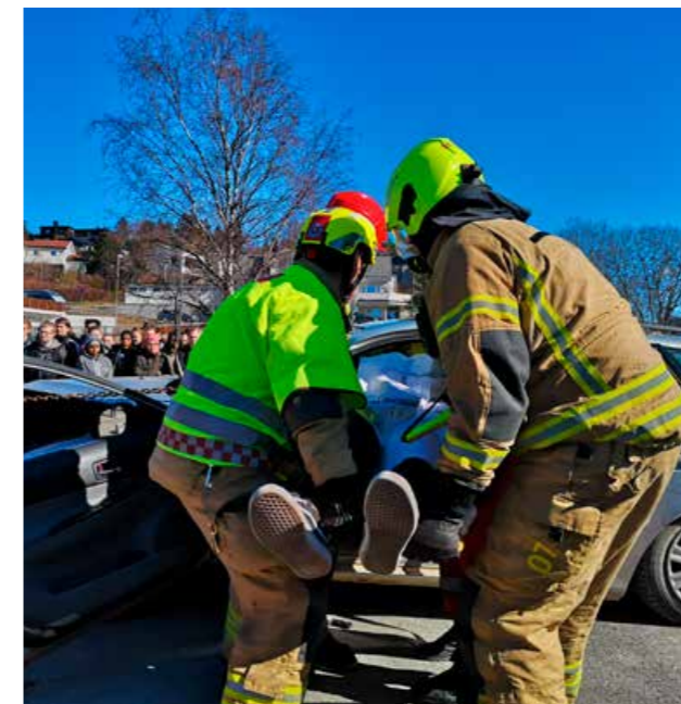
Det ser virkelig ut når elevene deltar som markører og redningsapparatet er i full sving på ulykkesstedet. Her ved forebyggingsdagen på Ole Vig og Aglo videregående skole.

Dette er et spennende prosjekt som retter seg mot ungdom i alderen 15–24 år. Grunnprinsippet for prosjektet er å gi motorinteressert og risikovillig ungdom en arena og mulighet for å drive med sin interesse under trygge forhold og med god veiledning. På den måten får de påfyll av gode holdninger og kunnskap om risiko i trafikken. Det er laget en egen rapport om dette tiltaket, for den som ønsker å lese mer om «Trøndelagsmodellen».