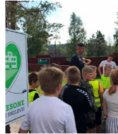
Det var stor festivitas da Rennebu barne- og ungdomsskole ble første Hjertesone-skole i Trøndelag.