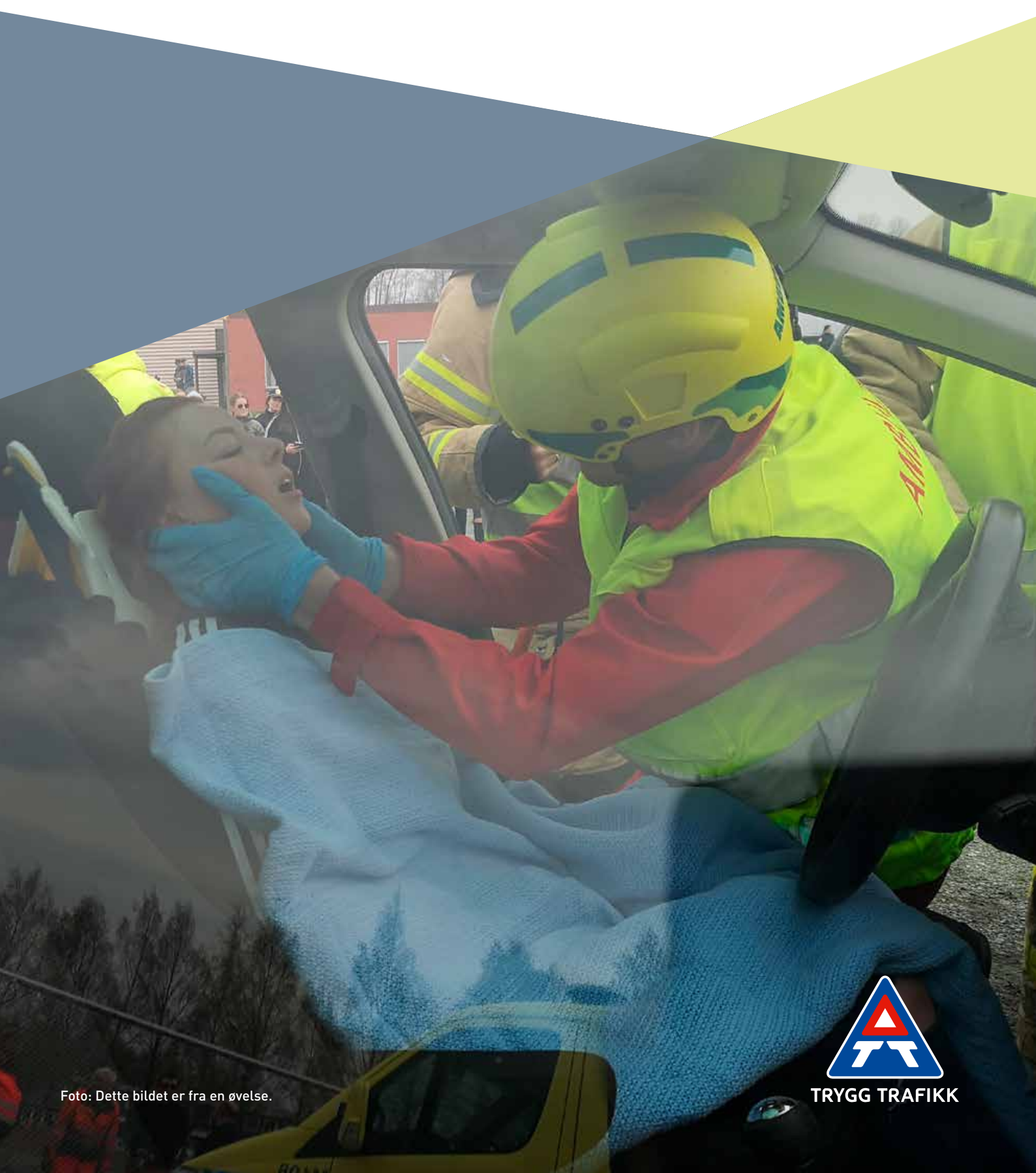
Foto: Dette bildet er fra en øvelse.