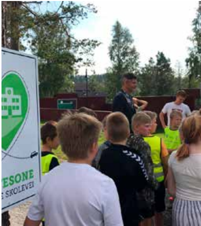
Det var stor festivitas da Rennebu barne og ungdomsskole ble første Hjertesone-skole i Trøndelag.