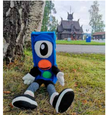
Lyset var selvfølgelig med, da det ble avholdt barnehagekurs på ærverdige Bårdshaug herregård på Orkanger.

utfordringer. Men alle som har ønsket det, har fått bistand til å fokusere på trafikksikkerhet i forbindelse med slike møter. I tillegg har mange skoler benyttet seg av Trygg Trafikk sitt opplæringsmateriell i forbindelse med trafikksikkerhetsopplæringen i skolene.