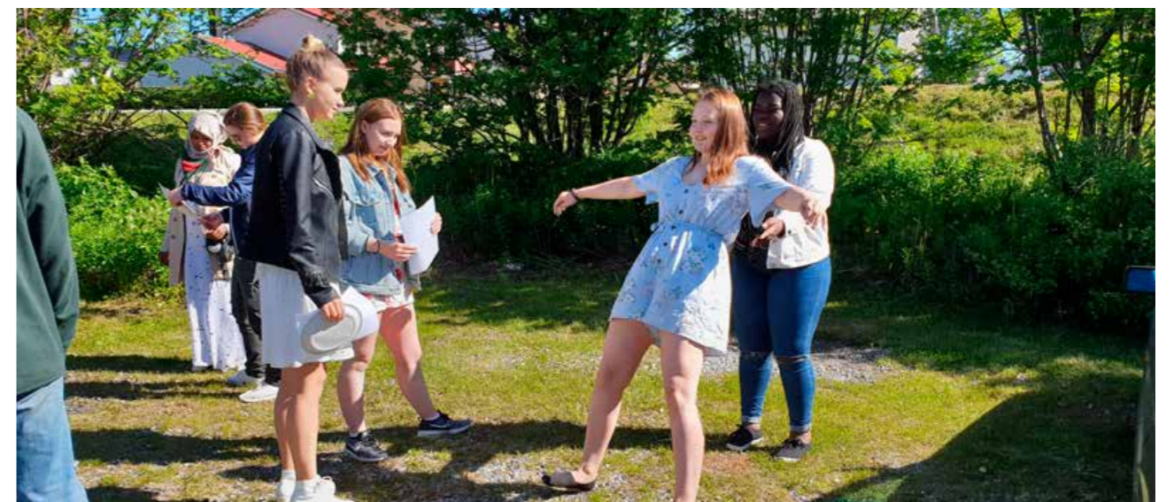
Ungdommen ved Vestlofoten videregående skole på trafikkdag.

trafikkforseelser. I april 2019 ble dette samarbeidet for første gang utvidet til også å gjelde yngre ungdom (14–20 år). Dette er ungdom som er i risikosonen for ulykker, og som vi anser som en viktig gruppe å samarbeide med.