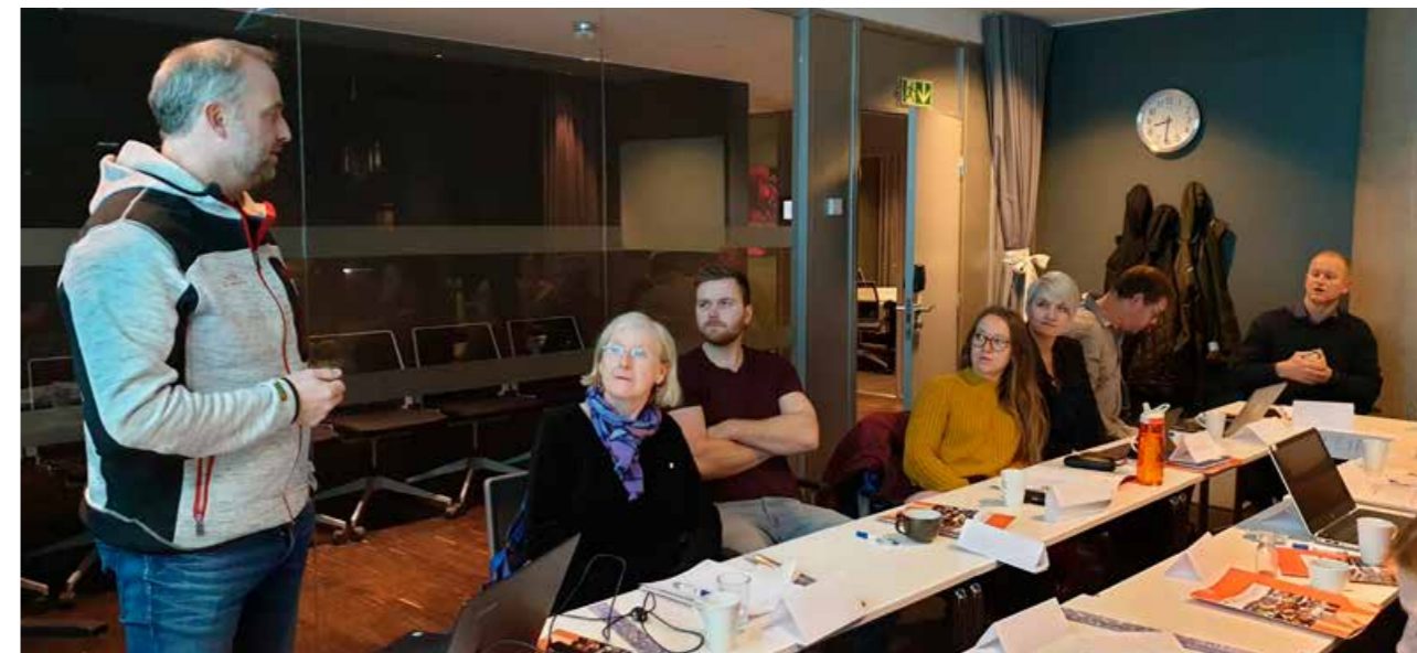
I november var det samling for trafiksikre kommuner i Nordland.