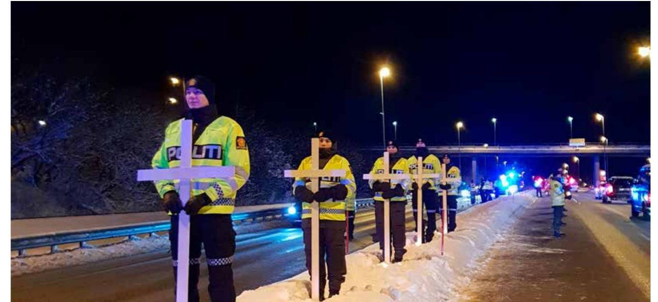
Politistudentene var med å holde kors som representerte de omkomne i trafikken i Nordland.