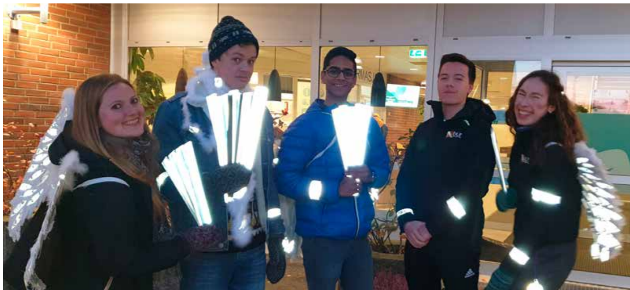
Medlemmer av Bodø ungdomsråd delte ut reflekser utenfor skolene på refleksdagen.