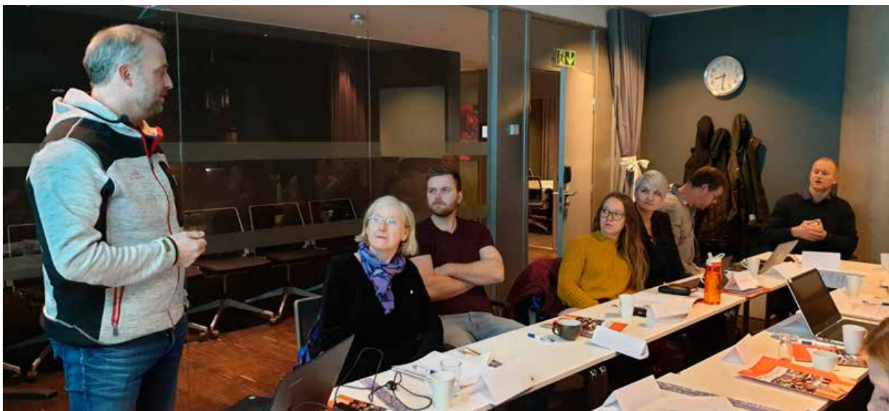
I november var det samling for trafikksikre kommuner i Nordland.