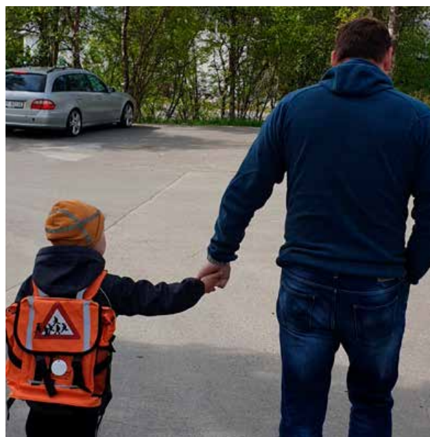
Trygg Trafikk Nordland jobber for at barn skal ferdes trygt i trafikken.

Flere barnehager har dessuten fått tilsendt materiell til bruk på foreldremøter.