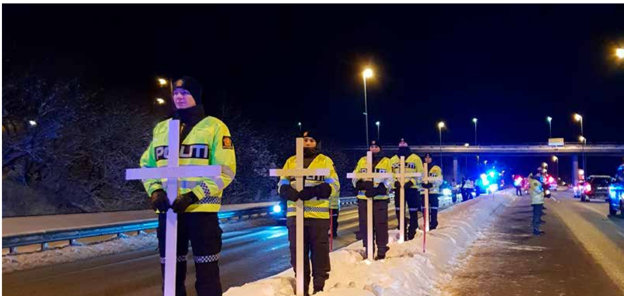
Politistudentene var med å holde kors som representerte de omkomne i trafikken i Nordland.