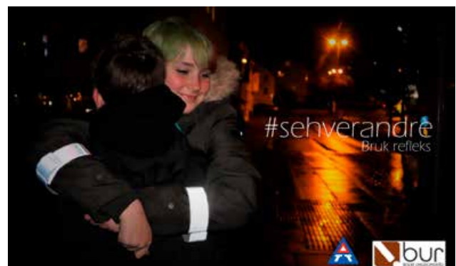
Bodø ungdomsråd lagde kampanjen #SeHverandre i samarbeid med Trygg Trafikk i forbindelse med refleksdagen.

Vi har også gjennom våre tre sykkelkurs denne våren satt søkelys på hjelmbruk.