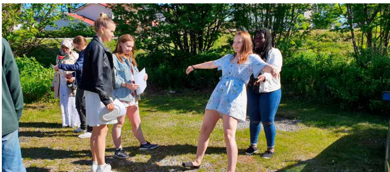
Ungdommen ved Vestlofoten videregående skole på trafikkdag.

trafikkforseelser. I april 2019 ble dette samarbeidet for første gang utvidet til også å gjelde yngre ungdom (14–20 år). Dette er ungdom som er i risikozonen for ulykker, og som vi anser som en viktig gruppe å samarbeide med.