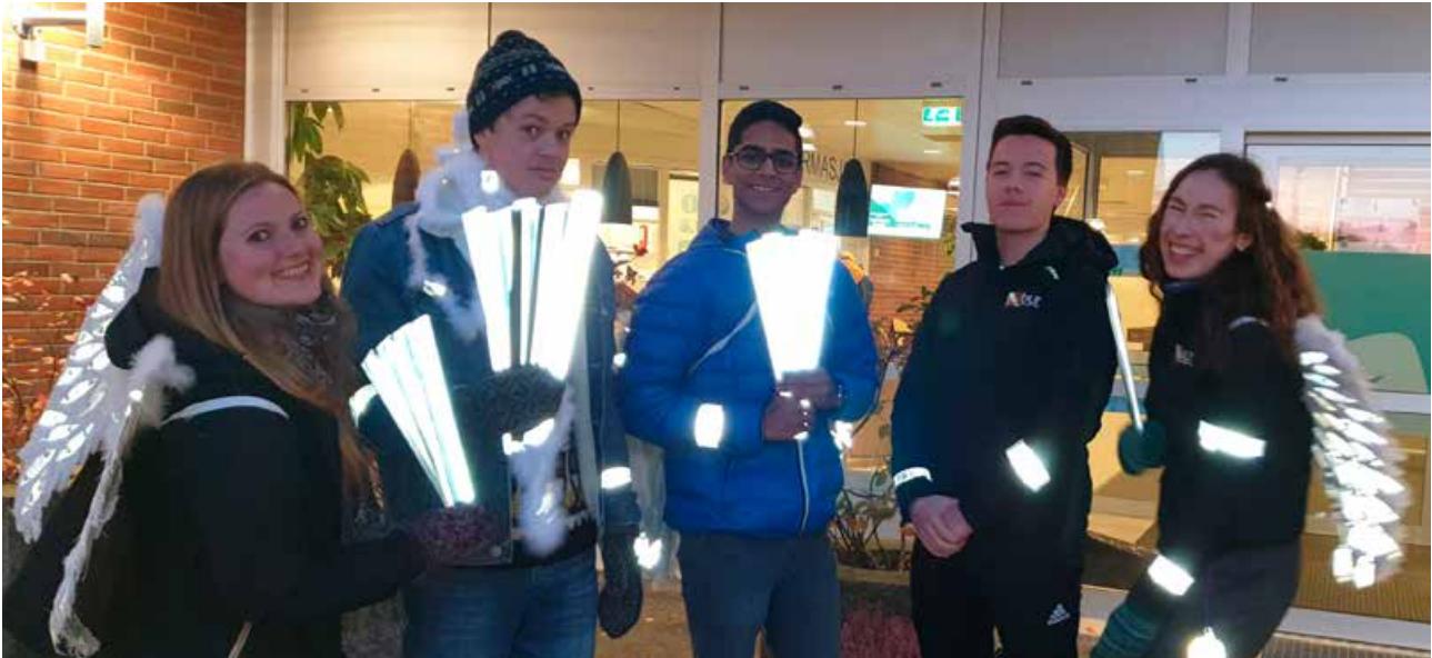
Medlemmer av Bodø ungdomsråd delte ut reflekser utenfor skolene på refleksdagen.