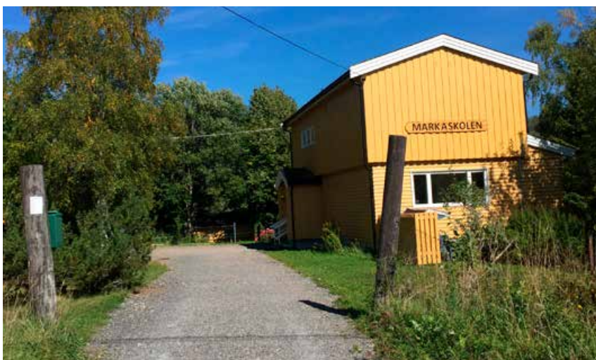
Markaskolen i Sørkedalen.

De ansvarlige ønsker i tillegg å arrangere en ekstra