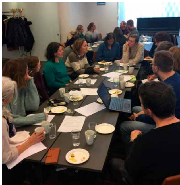
Fire nye Hjertesone-skoler i Oslo har workshop.

Tellinger i Oslo i 2019 viste at 65 % av barna under 3 år satt bakovervendt. Politidistrikt Øst, Sentrum samt Trafikkorpset i Oslo har bistått i tellingene. Undersøkelsen er gjort i alle byområder, og Oslo er det nest beste fylket i landet på dette.