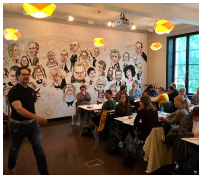
Barnehagekurs på Litteraturhuset i Oslo

Trygg Trafikk tilbyr alle barnehager gode redskaper til trafikkopplæringen, spesielt gjennom Barnas Trafikkklubb.