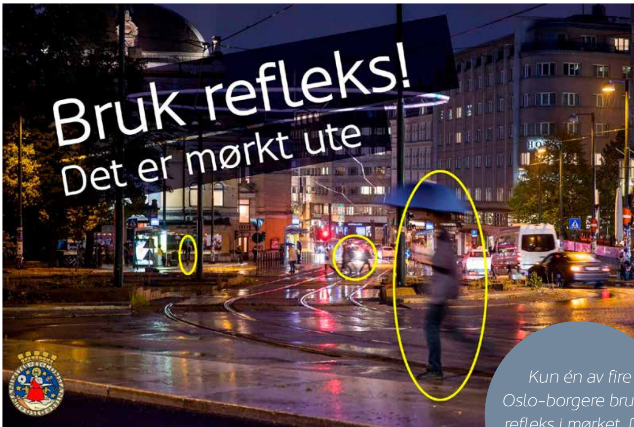
Reflekskampanjen «Mørket kommer» på Facebook.

Kun én av fire Oslo-borgere bruker refleks i mørket. Det er dårligst i landet!