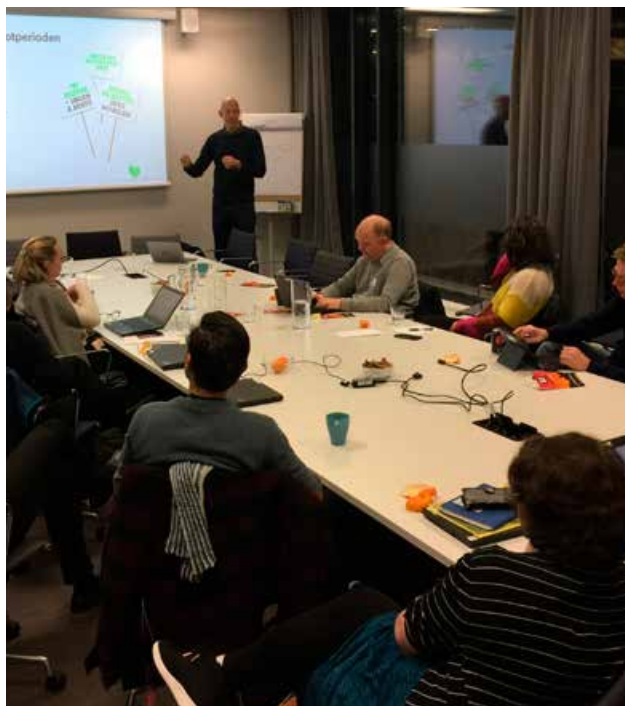
Aktørene i trafikk sikkerhetsarbeidet har gode møte plasser og nettverk. Trafikk sikkerhetsplanen for Oslo 2019–2022.

Den årlige nasjonale Trafikk sikkerhetskonferansen, som Trygg Trafikk er ansvarlig for, er en viktig møteplass for aktørene i trafikk sikkerhetsarbeidet, og Oslo kommune stiller med et godt mannskap på konferansen.