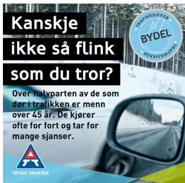
Eksempel på informasjon til innbyggerne i Bydel Østensjø.

Bydel Østensjø er den eneste trafikk sikre bydelen i Oslo. Nå ønsker vi at andre bydeler følger etter.