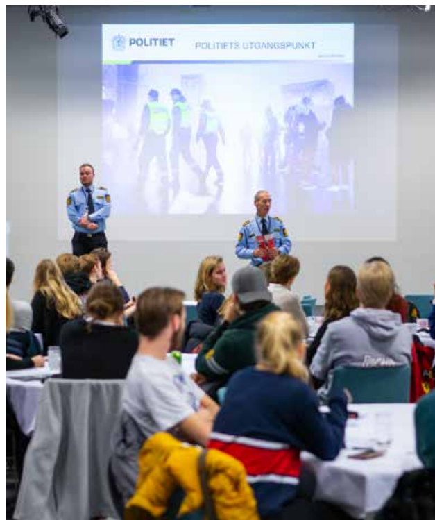
Seminar for 200 avgangselever og skoleledelsen ved de videregående skolene i Oslo og Akershus.

I 2019 har Trygg Trafikk i samarbeid med Bydel Østensjø og Bøler skole laget en såkalt bilfri skolereiseplan for elevene, en omfattende plan som har trafikkopplæring på alle