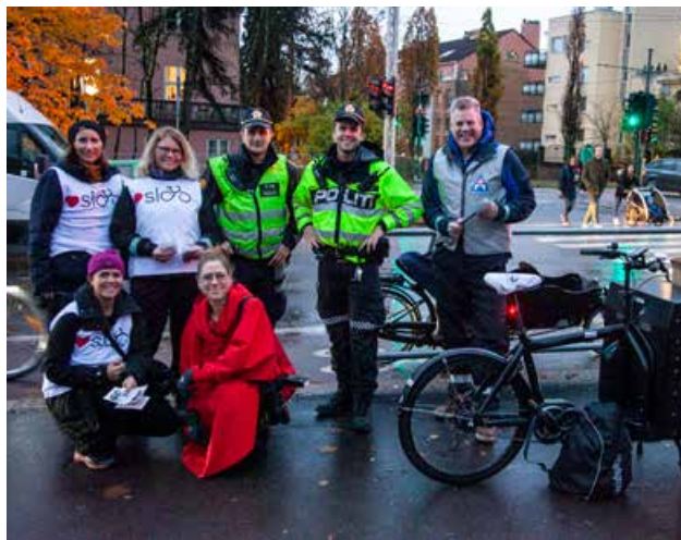
Den årlige sykkellyktkampanjen. Syklistenes Landsforening.

Tellingene i Torggata viser at andelen syklister med godkjent sykkellykt foran og bak har økt med 30 % på kveldstid og 10 % om morgenen i perioden 2015–2019.