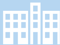
BYDEL S. 3