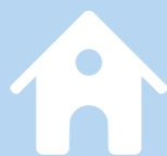
BARNEHAGE S. 6