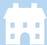
SKOLE S. 9