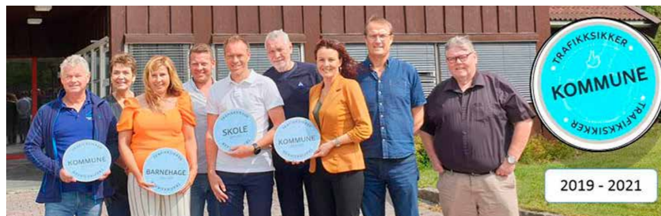
Kommunale ledere og representanter fra Trygg Trafikk under sertifiserings-samling.

Distriktsleder i Trygg Trafikk Aust-Agder deltar i møte, kursvirksomhet og godkjenninger av trafiksikre kommuner over hele landet.