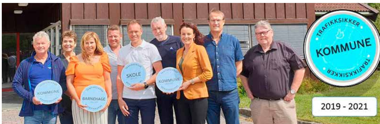
Kommunale ledere og representanter fra Trygg Trafikk under sertifiseringssamling.

Distriktsleder i Trygg Trafikk Aust-Agder deltar i møte, kursvirksomhet og godkjenninger av trafikk sikre kommuner over hele landet.