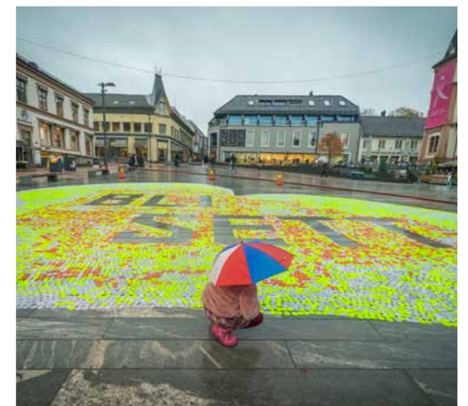
Verdens største refleks hjerte lage av nesten 36 000 reflekser.