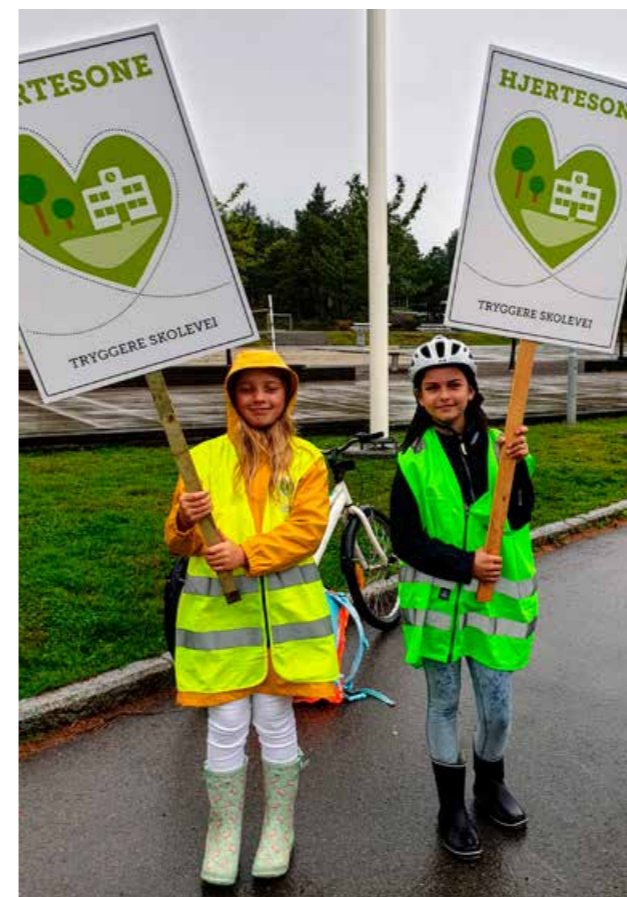
Elevene på Teie skole jobber for å få sin egen Hjertesone.

Det har høy prioritet at elever skal ha trygge skoleveier. Det er hvert år viktig å minne både foreldre og andre som kjører langs skoleveiene, på at de må ta spesielt hensyn.