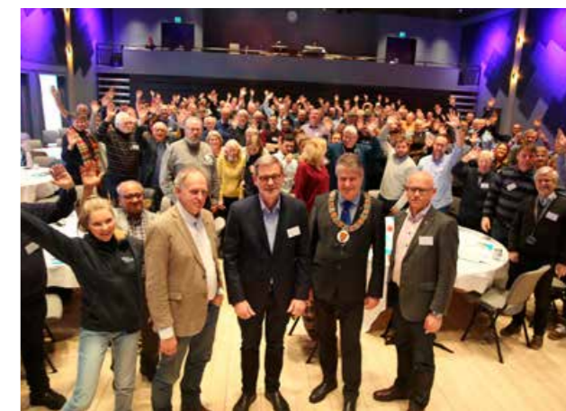
Trafikk sikkerhetskonferansen i regi av Telemark, Buskerud og Vestfold har vært en flott møteplass for å sette fokus på trafikk sikkerhet.

I 2018 var den nye trafikk sikkerhetsplanen for perioden 2018–2021 på plass. Denne bygger på nasjonale føringer og planer. Nasjonal tiltaksplan for trafikk sikkerhet på veg og Meld. St. 40 (2015–2016) om samordning og organisering av trafikk sikkerhetsarbeidet er sentrale planer. Trygg Trafikk planverk bygger også på disse føringene, noe som gjør at vi får en god sammenheng mellom sentrale og lokale planer.