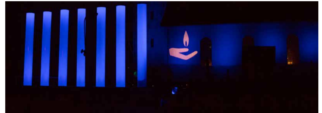
Syv søyler for de som døde på Vestfoldveiene i 2019.