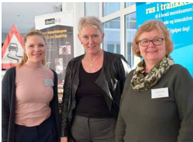
Trafikksikkerhetskonferansen i regi av Telemark, Buskerud og Vestfold har vært en flott møteplass for å sette fokus på trafikksikkerhet.