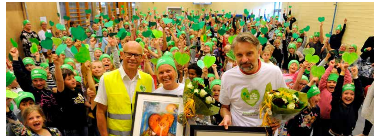
Trafikksikkerhetsprisen. Gokstad skole fikk Trafikksikkerhetsprisen i 2019 for sitt arbeid med å sette Hjertesone på kartet.