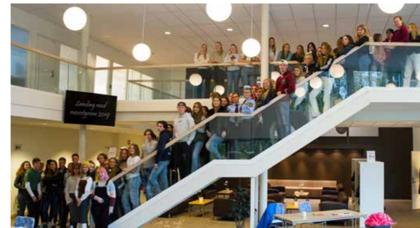
Elever fra russestyrene og elevrådene ved de videregående skolene var samlet på Jartsberg konferansesenter for en fagdag med fokus på trafikk og helse.