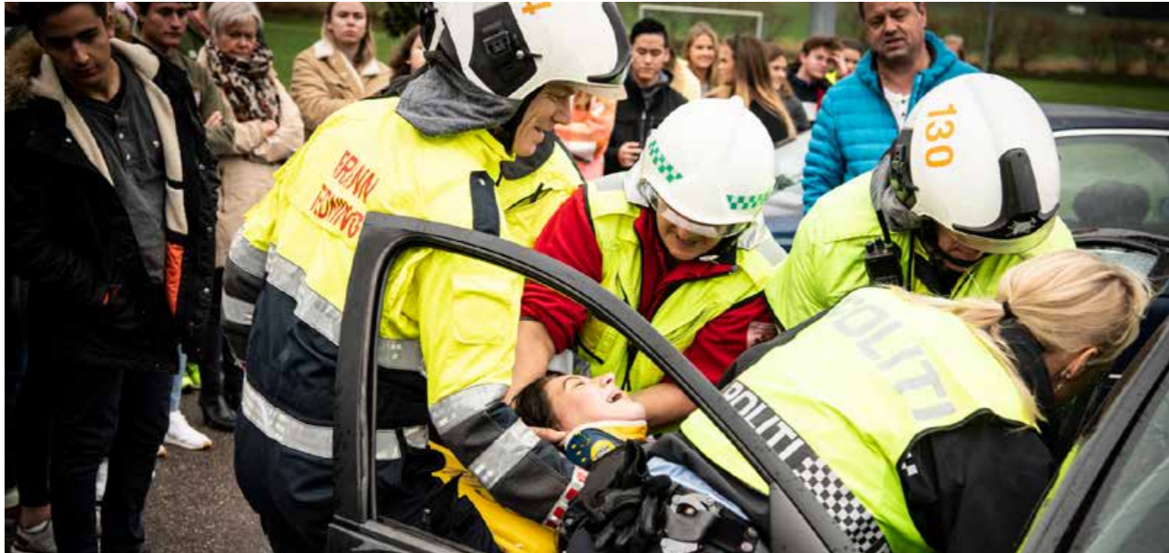
En demonstrasjon med utrykningspersonell i arbeid under en trafikulykke.