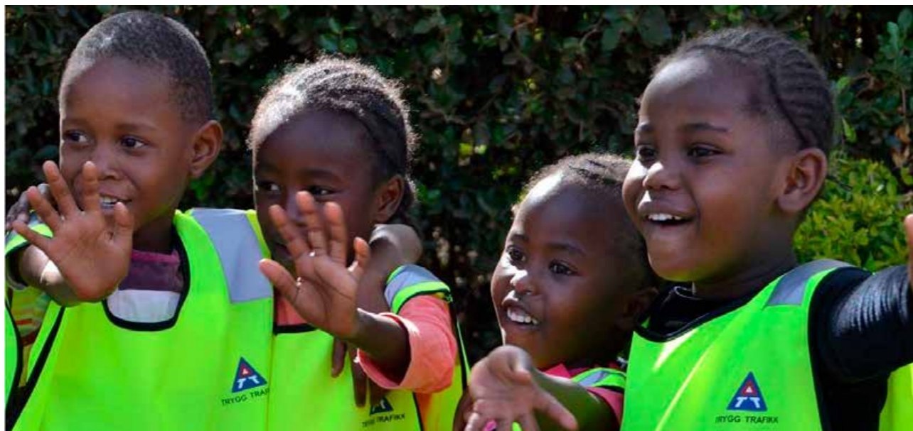
Barna på en skole i Nairobi er glade for refleksvester fra Trygg Trafikk.

” Sykkelpørvøen skal være en motivasjonsfaktor både for lærere og elever. Sykkelpørvøen og forberedelse til denne kan også være et bidrag for å nå kompetansemålene i læreplanen.