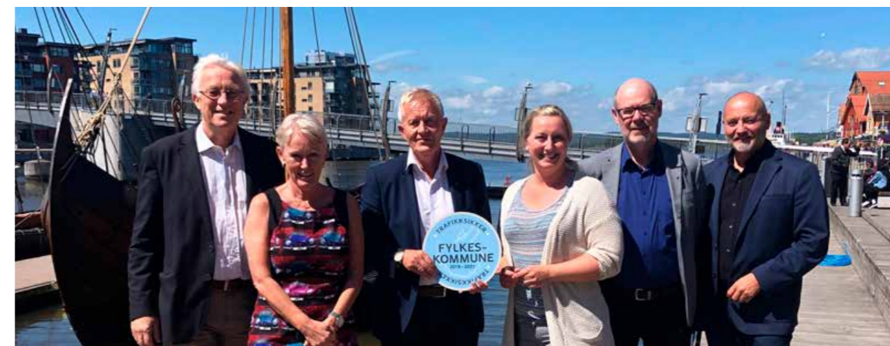
Fylkeskommunen ble i 2019 godkjent som Trafikksikker fylkeskommune.

Vi må fortsatt sette søkelys på trafiksikker atferd og bruk av sikkerhetsutstyr som hjelm og refleks.