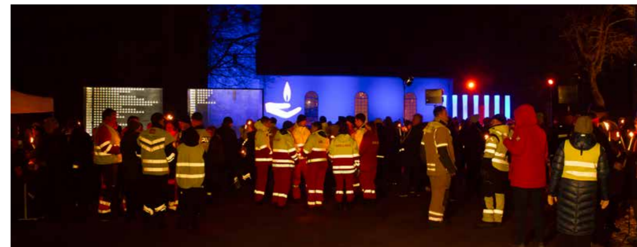
Før fakkeltoget ved Skjee kirke.

Minnemarkeringen har en egen Facebook-side med cirka 4700 følgere.