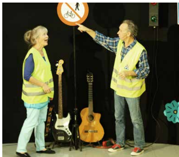
Mange barn koste seg med trafikkkforestillingen Ville veier og vrangt skilt.

Etter en stor vervekampanje i 2018, samt kursvirksomhet i løpet av 2019, har Akershus nå nesten 470 barnehager som er medlemmer i Barnas Trafikkklubb. Dette utgjør godt over 50 % av barnehagene i fylket, noe som også var målet i 2019. Medlemskapet i klubben er gratis og inkluderer et komplett undervisningsopplegg til bruk i løpet av barnehageåret. Mange barnehager bruker elementer fra klubben i sine årsplaner, på foreldremøter, når de går på tur, og