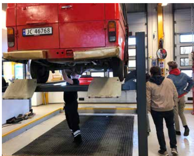
Russebilkontroll i Drammen.

TA VARE-kampanjen retter seg mot ungdom i idrettslag i fylket. Den ble initiert av fylkesordføreren i 2009, og Buskerud fylkeskommune er prosjekteier. Trygg Trafikk er med i arbeidet. Kampanjen får stadig med flere idrettslag, og vi ser at klubbene lager reisepolicy og gjennomfører forskjellige trafikksikkerhetsaksjoner.