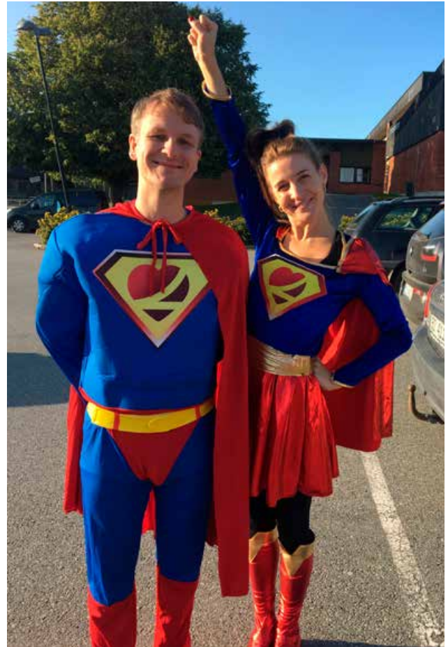
Beltehelter utenfor Vestfossen skole.

Øren skole i Drammen er en foregangsskole i Buskerud, og FAU har definert hjertesonen rundt skolen. De har også etablert gå-grupper, det er foreldre som på rundgang følger grupper av barn til skolen. Flere skoler i fylket er nå i gang med å etablere hjertesoner. I 2019 ble Hjertesone-prosjektet rundt Øren skole evaluert. Trygg Trafikk var en viktig bidragsyter i dette evalueringsarbeidet, og rapporten gir oss nyttig informasjon til det videre arbeidet.