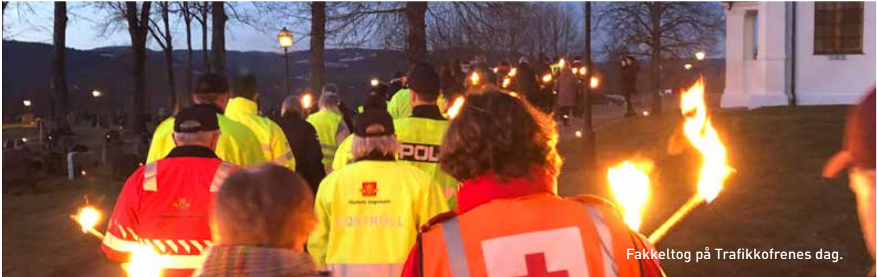
Fakkeltog på Trafikkofrenes dag.