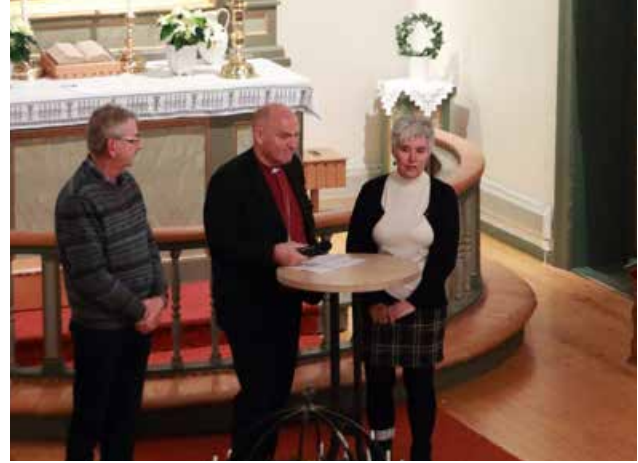
Biskop og pårørende på Trafikkofrenes dag.