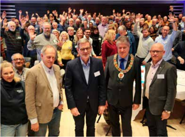
FTU-lederne i Telemark, Vestfold og Buskerud på Trafikksikkerhetskonferansen 2019