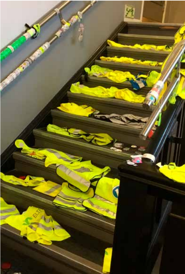
Resultatet etter Den store refleksjakten i 4. klasse på Danvik skole.