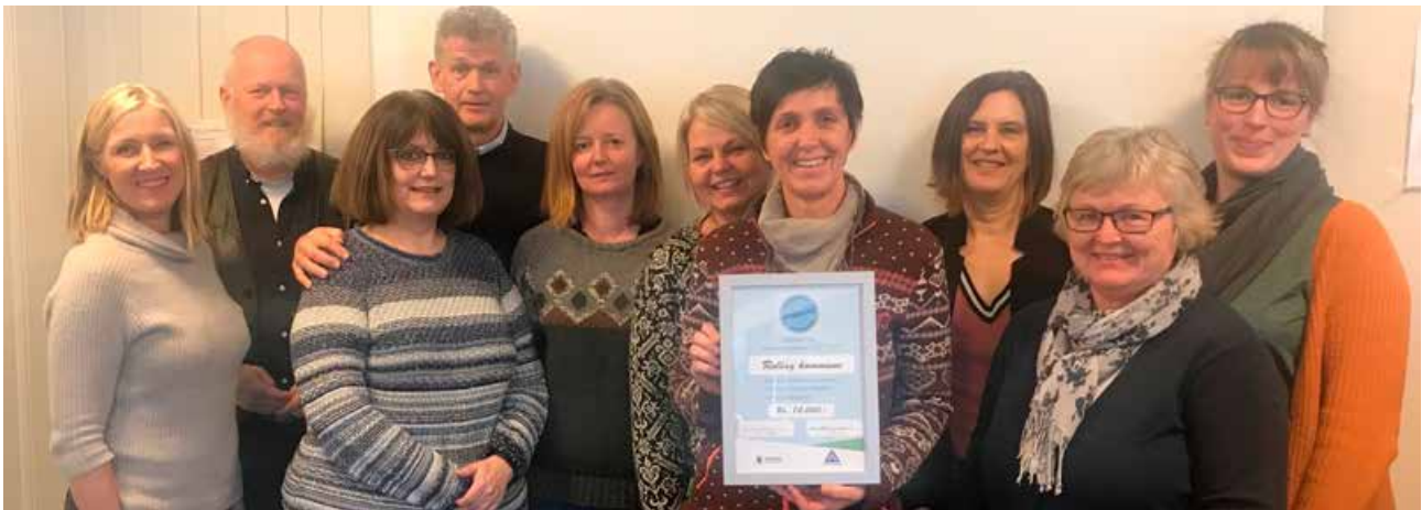
Rollag kommune blir regodkjent.

Det var spesielt gledelig å se resultatene i Rollag fra kartleggingen som TØI gjennomfører i forbindelse med regodkjenningen. Her svarte nesten 80 % av kommunens ansatte at de er mer opptatt av trafikk sikkerhet,....., og at de oppfører seg sikrere i trafikken nå. Dette viser at arbeidet fungerer.