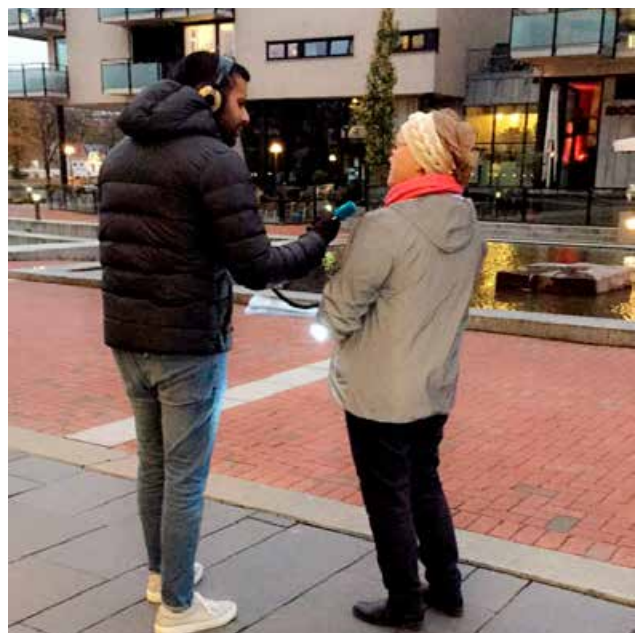
Intervju med NRK Buskerud på refleksdagen.

En stor andel syklister bruker ikke sykkelhjelm, til tross for at dette reduserer risikoen for alvorlig hodeskade. For å bli godkjent som trafikksikker kommune må kommunen dokumentere at de har en vedtatt reisepolicy for sine ansatte. Her inngår alltid kravet om bruk av sykkelhjelm for syklister.