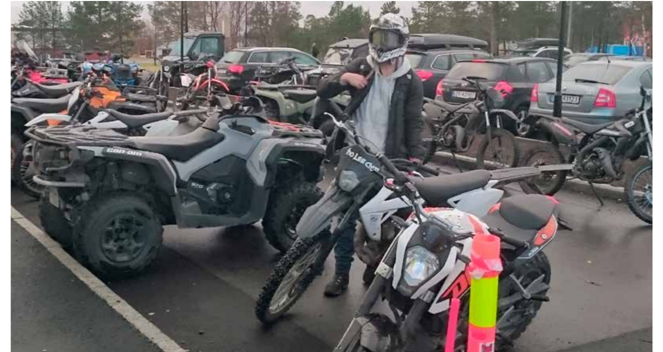
ATV er blitt et populært kjøretøy for ungdom i den videregående skolen i Alta.

” ATV/UTV er blitt et meget populært kjøretøy for ungdom mellom 16 og 18 år i fylket. Vi er bekymret for at antallet ulykker med disse kjøretøyene vil øke.