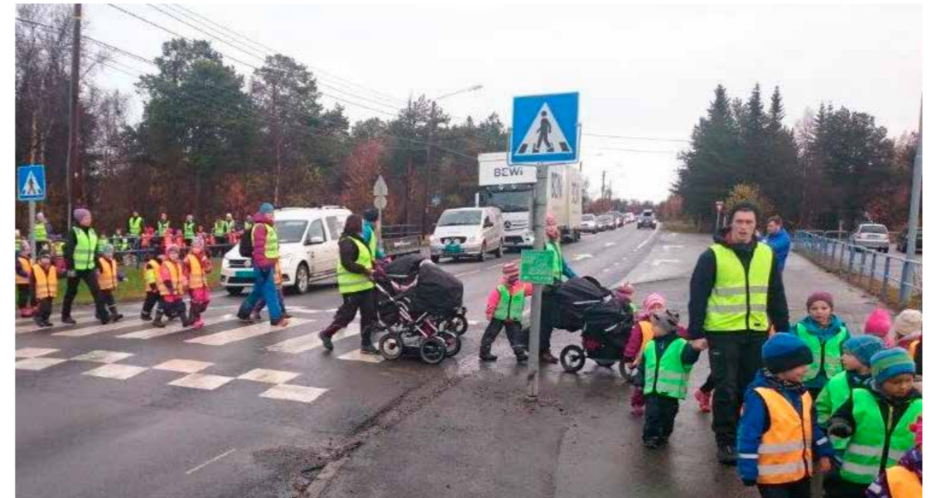
Barnehagene i Alta markerer Refleksdagen med et eget reflekstog.

tiltak for elever i fem kommuner i fylket.