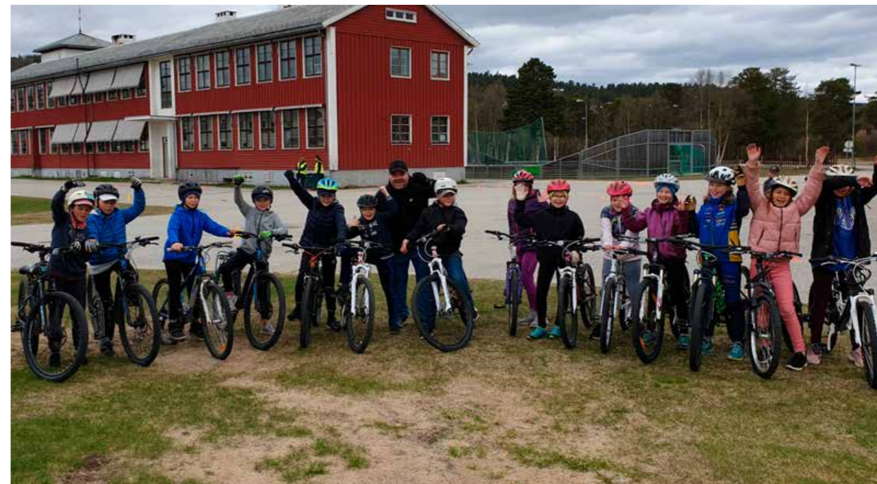
Elever ved Karasjok barneskole har gjennomført sykkelprøven, dette synes de var kjempe gøy!

Det er også spredd bosetting, med mange små kommuner som ikke ser at de har noen utfordringer. Det de ikke tenker på, er at de aller fleste ungdommer reiser