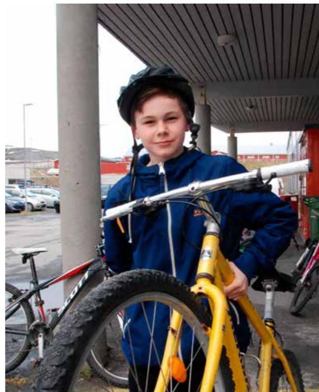
Husk å fest hjelmen og ikke glem å sjekk bremses på sykkelen!

Fylkeskommunen og Importørforeningen samarbeider om et prøveprosjekt rettet mot kjøpere av ATV/UTV. Målet