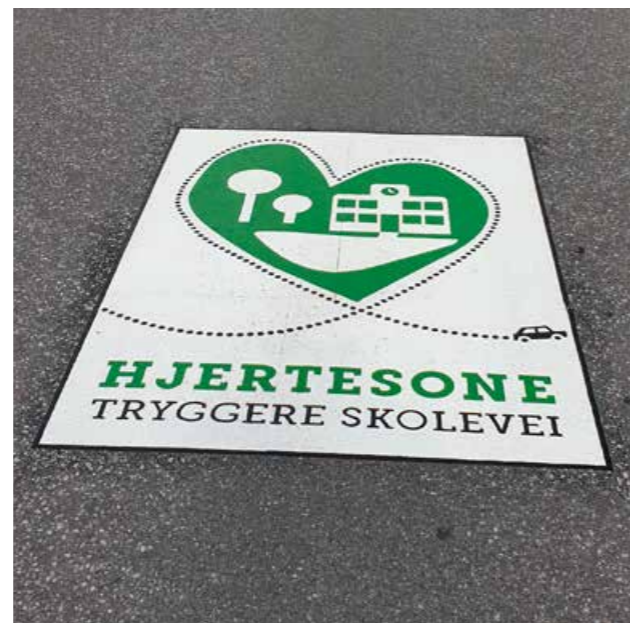
Veimerking ved skolene i Vadsø.

Gjennom et samarbeid med Finnmark Fotballkrets har vi gjennom i Bolyst-prosjektet gjennomført trafikksikrings-