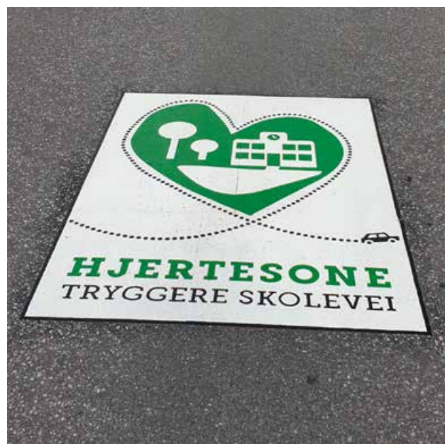
Veimerking ved skolene i Vadsø.

Gjennom et samarbeid med Finnmark Fotballkrets har vi gjennom i Bolyst-prosjektet gjennomført trafikksikrings-