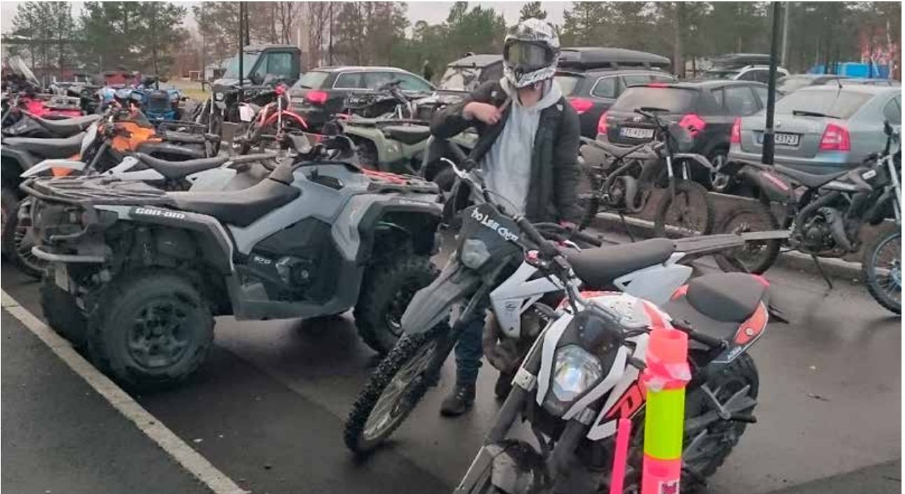
ATV er blitt et populært kjøretøy for ungdom i den videregående skolen i Alta.