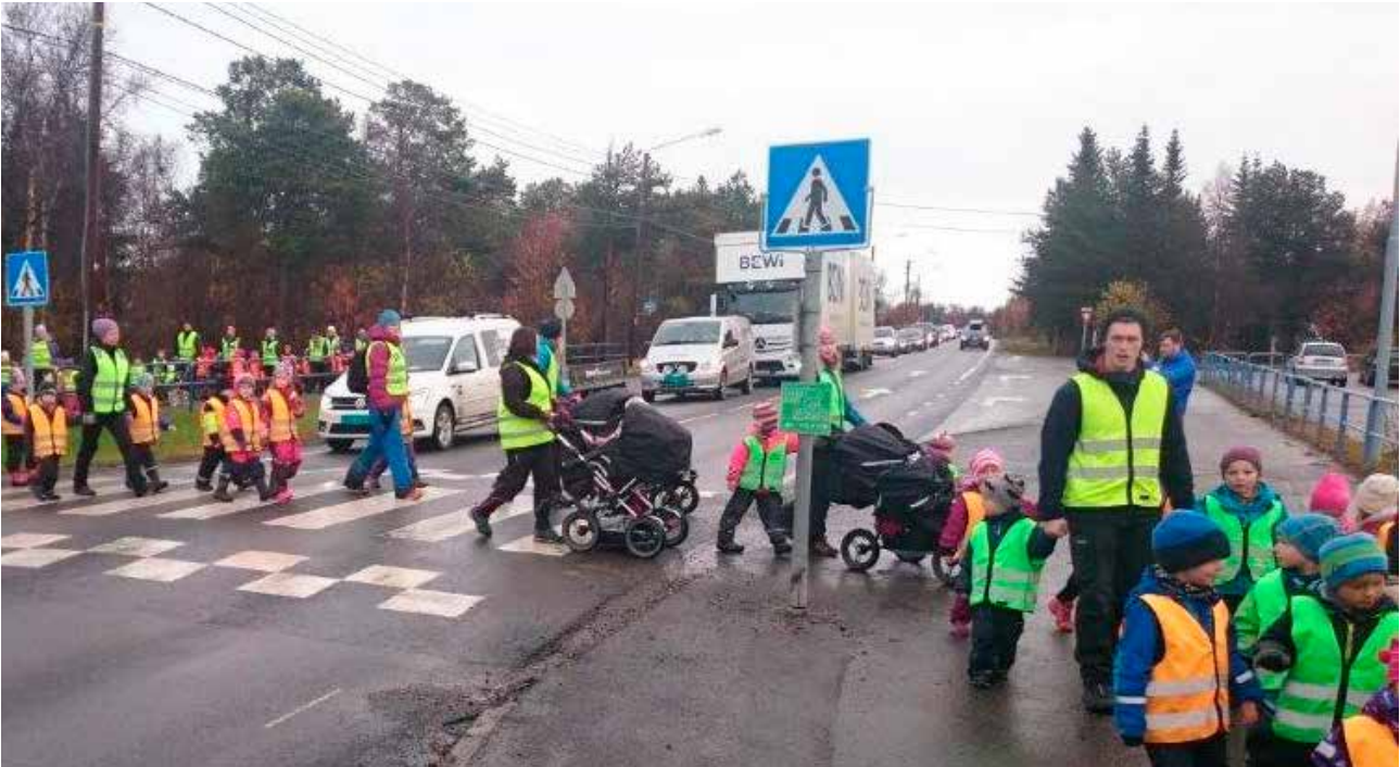
Barnehagene i Alta markerer Refleksdagen med et eget reflekstog.

tiltak for elever i fem kommuner i fylket.