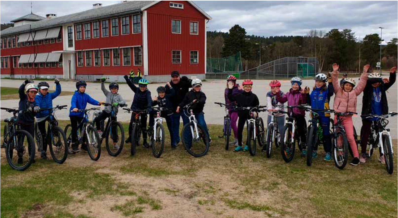
Elever ved Karasjok barneskole har gjennomført sykkelprøven, dette synes de var kjempe gøy!

for å gå på skole i større byer, og da er det viktig at de har basisferdighetene som trengs for å ferdes trygt i trafikken.