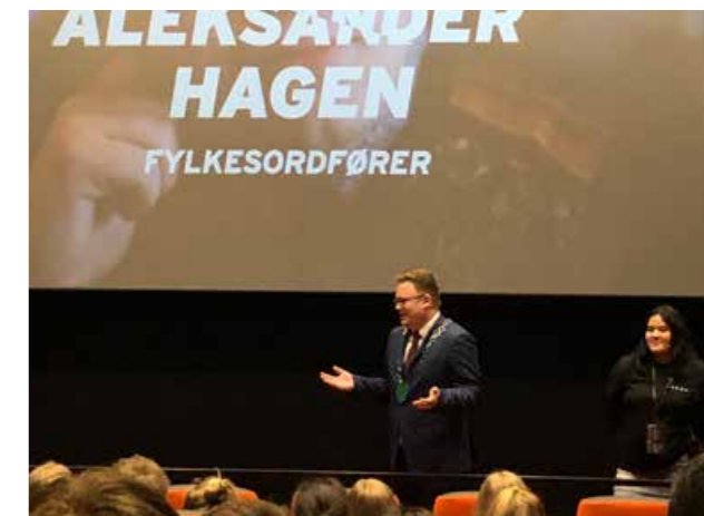
Fylkesordføreren åpnet ungdomskonferansen LoggInnlandet.

” Ungdom eksponeres for trafikkfarlige situasjoner på flere måter. I byene velger unge ofte kollektivtransport, og de går eller sykler framfor å kjøre bil. I distriktene er bilen viktigere. ”