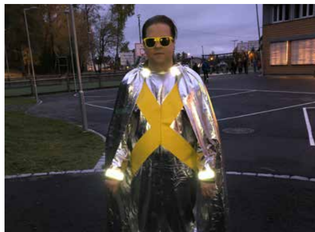
Thomas refleksmannen på refleksens dag.

Refleksjakten viser at det er mange reflekser i norske hjem, men tellingene viser at det dessverre ikke er alle som bruker dem.