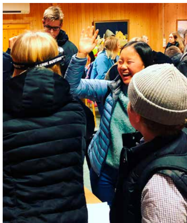
I flere år har vi arrangert trafikksikkerhetsdag for konfirmanter i Løten.

Færre ungdommer i alderen 15–24 år har omkommet eller blitt hardt skadd i trafikken de siste årene. Likevel er ungdom, spesielt unge bilførere, fortsatt høyt representert på ulykkesstatistikken. I arbeidet mot nullvisjonen er ungdom en viktig målgruppe. Ungdom eksponeres for trafikkfarlige situasjoner på flere måter. I byene velger unge ofte kollektivtransport, og de går eller sykler framfor å kjøre bil. I distriktene er bilen viktigere. Det er mange som bruker bil til skole og aktiviteter, og i en del miljøer er bilen en viktig hobby. De som er opptatt av bil, kjører mer enn andre og er dermed mer utsatt for ulykker. Trygg Trafikk har to tilnæringer i ungdomsarbeidet. Hovedsatsingen er opplæringstiltak i skolen. Disse tiltakene er rettet mot alle. Hensikten med tiltakene er å styrke den gode atferden. I tillegg er det nødvendig å rette spesielle tiltak mot de mest risikoutsatte ungdommene.