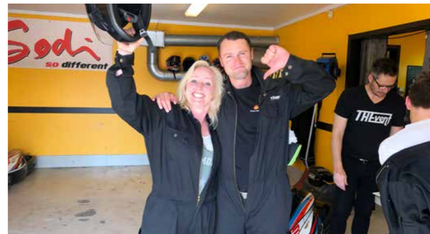
Bra stemning på Vålerbanen.

I Hedmark er det flere klubber for motorinteressert ungdom, og Trygg Trafikk har vært innom flere av klubbene i 2019 også. Det er Glatta i Ringsaker og på Tynset, Kjør for livet i Løten og Solør, Vinger mekk & moro i Kongsvinger og Bajasverkstedet i Elverum, for å nevne noen.