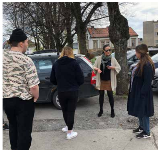
Det ble holdt et heldagskurs for barnehageansatte i 2019.

På campus Hamar ved Høgskolen i Innlandet arrangerte vi et heldagskurs for studentene på barnehagelærerutdanningen. I tillegg arrangerte vi et sykkelkurs for studentene på folkehelsestudiet ved campus Elverum. Deltakere på introduksjonskurset for flykninger gjennomførte teorikurs og fikk sykkelopplæring.