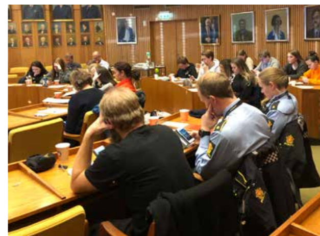
Verdiseminar for Glåmdalsregionen.