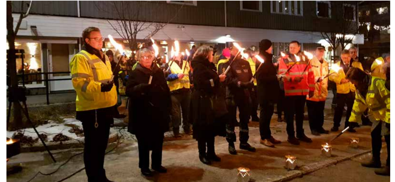
Under minnemarkeringen i Moelv ble det tent fem lys for de omkomne i Hedmark.