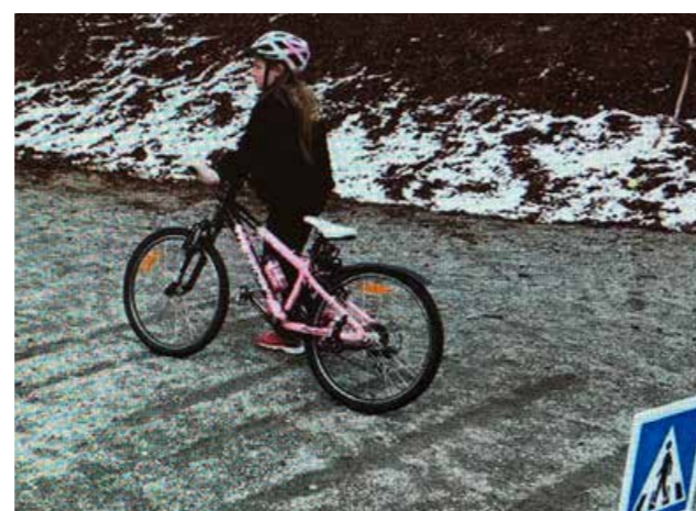
Sykkeldag i april med nysnø på bakken.

Trygg Trafikk har også arrangert trafiksikkerhetsdager på introduksjonskursene for innvandrere og flykninger, da med søkelys på sikring av barn i bil, refleksbruk og beltebruk. Tilbakemeldingene har vært positive, så dette vil vi fortsette med i 2020.