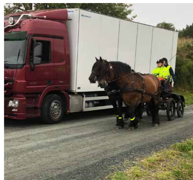
Demonstrasjon av utfordringer i trafikken.