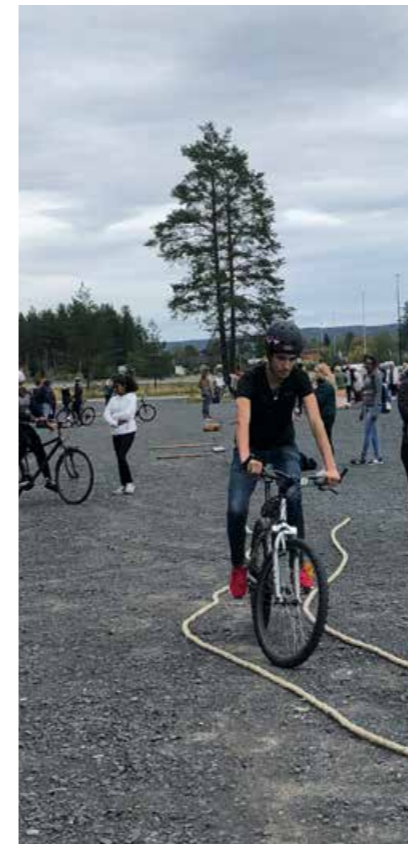
Konstrasjonen var på topp under sykkel dagen i Elverum.