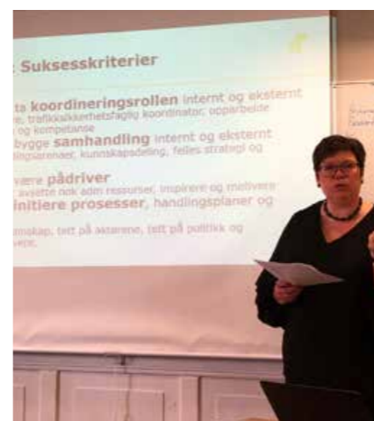
FTUlederen i Trøndelag deler sine erfaringer om regionreformen.