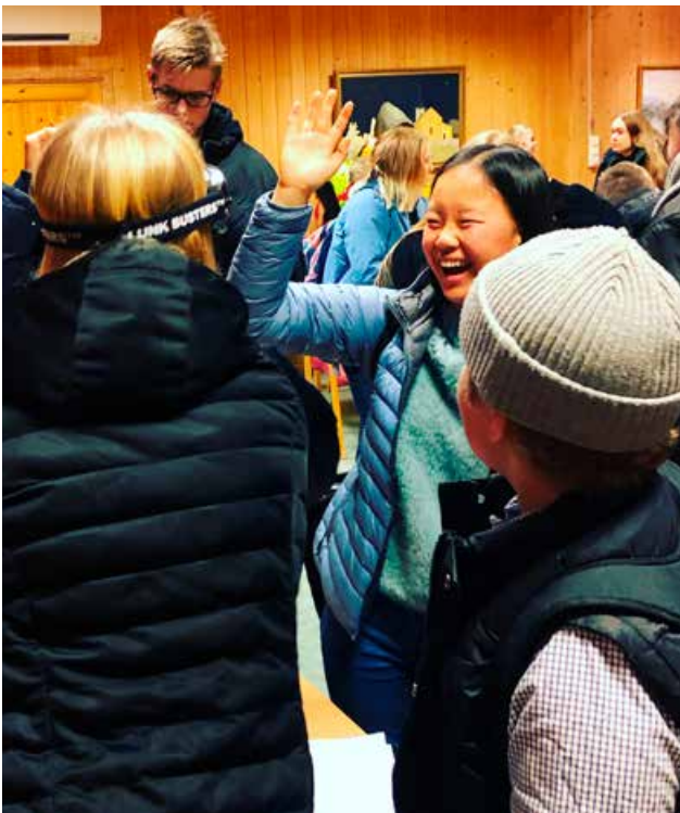
I flere år har vi arrangert trafikksikkerhetsdag for konfirmanter i Løten.

Færre ungdommer i alderen 15–24 år har omkommet eller blitt hardt skadd i trafikken de siste årene. Likevel er ungdom, spesielt unge bilførere, fortsatt høyt representert på ulykkesstatistikken. I arbeidet mot nullvisjonen er ungdom en viktig målgruppe. Ungdom eksponeres for trafikkarfarlige situasjoner på flere måter. I byene velger unge ofte kollektivtransport, og de går eller sykler framfor å kjøre bil. I distriktene er bilen viktigere. Det er mange som bruker bil til skole og aktiviteter, og i en del miljøer er bilen en viktig hobby. De som er opptatt av bil, kjører mer enn andre og er dermed mer utsatt for ulykker. Trygg Trafikk har to tilnæringer i ungdomsarbeidet. Hovedsatsingen er opplæringstiltak i skolen. Disse tiltakene er rettet mot alle. Hensikten med tiltakene er å styrke den gode atferden. I tillegg er det nødvendig å rette spesielle tiltak mot de mest risikoutsatte ungdommene.