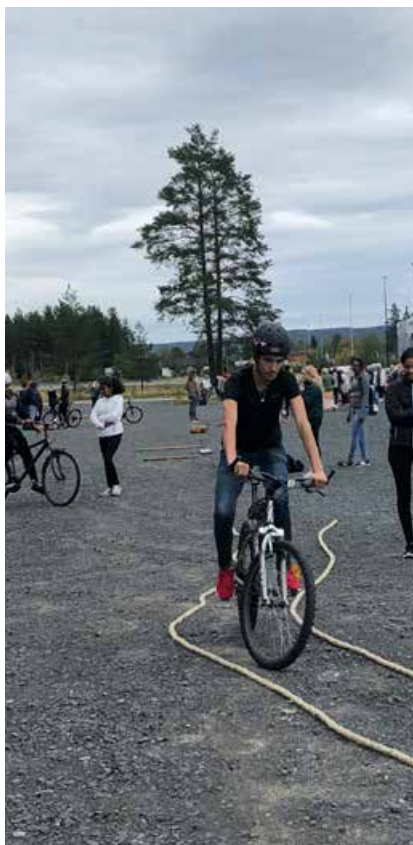
Konstrasjonen var på topp under sykkel dagen i Elverum.