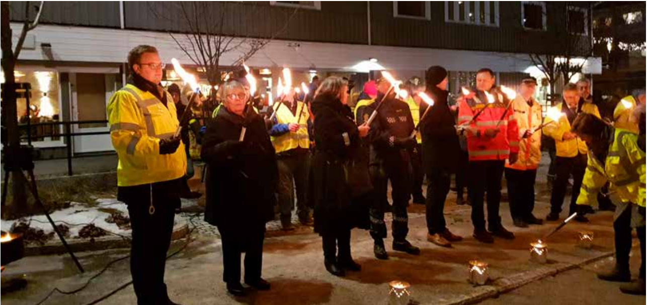
Under minnemarkeringen i Moelv ble det tent fem lys for de omkomne i Hedmark.