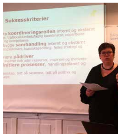
FTUlederen i Trøndelag deler sine erfaringer om regionreformen.