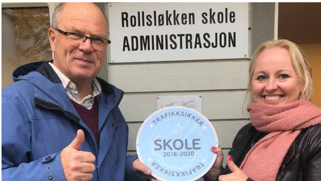
Rektor ved Rollsløkka skole får overrekket prisen som Hamars første trafikk sikre skole.

kommune, og her gjenstår kun noen små justeringer før kommunen kan godkjennes. Hedmark var først ute med å godkjenne Norges første trafikk sikre barnehage, og det har vært mye oppmerksomhet om barnehage og skole.