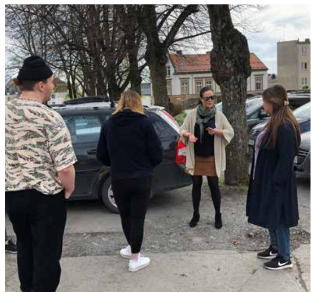
Det ble holdt et heldagskurs for barnehageansatte i 2019.

På campus Hamar ved Høgskolen i Innlandet arrangerte vi et heldagskurs for studentene på barnehagelærerutdanningen. I tillegg arrangerte vi et sykkelkurs for studentene på folkehelsestudiet ved campus Elverum. Deltakere på introduksjonskurset for flykninger gjennomførte teorikurs og fikk sykkelopplæring.