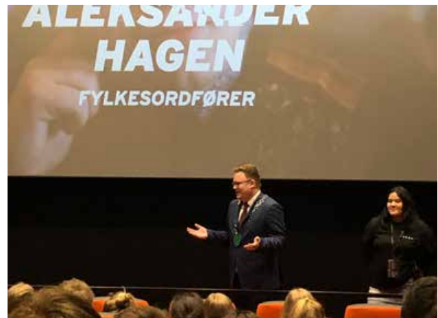
Fylkesordføreren åpnet ungdomskonferansen LoggInnlandet.