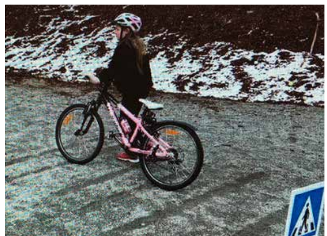
Sykkeldag i april med nysnø på bakken.