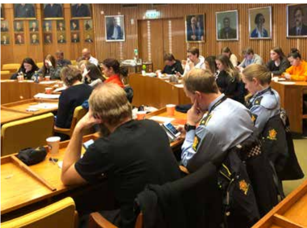
Verdiseminar for Glåmdalsregionen.