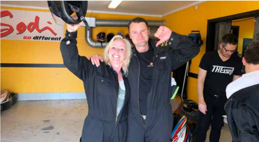
Bra stemning på Vålerbanen.