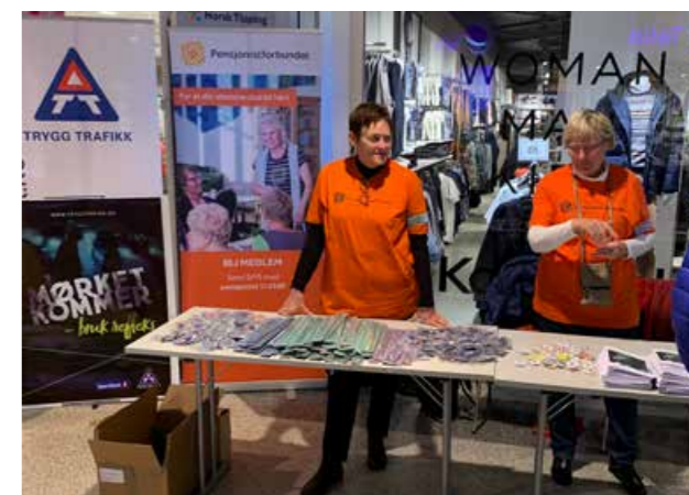
Refleksdagen – her med god hjelp fra pensjonistforbundet