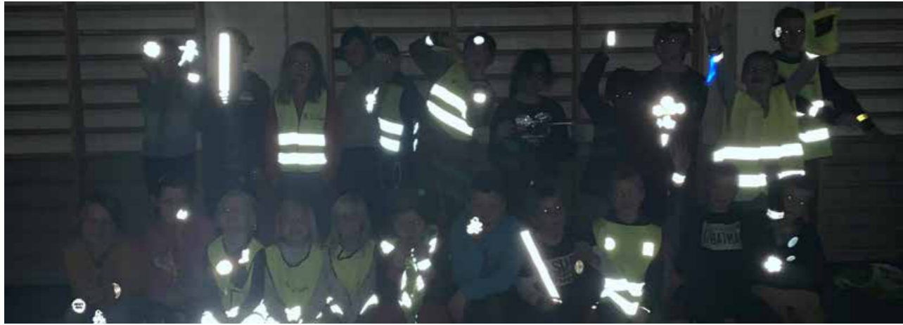
1. til 4. trinn på Kolbu skole har markert refleksdagen i grupper på tvers av trinnene. De har snakket om hvor viktig det er å bruke refleks, hatt fargeleggingsoppgaver og sett film om refleks.

Det kommer svært mange henvendelser fra foreldre, kommuner og Fylkesmannen angående «særlig farlig skolevei» i opplæringsloven § 7. Trygg Trafikks veileder om emnet er etterspurt, og den sendes ut til alle som ønsker den. Det gis mye veiledning over telefon. Trygg Trafikks rolle er å bistå kommuner og foreldre slik at relevante momenter blir vurdert før vedtak fattes.