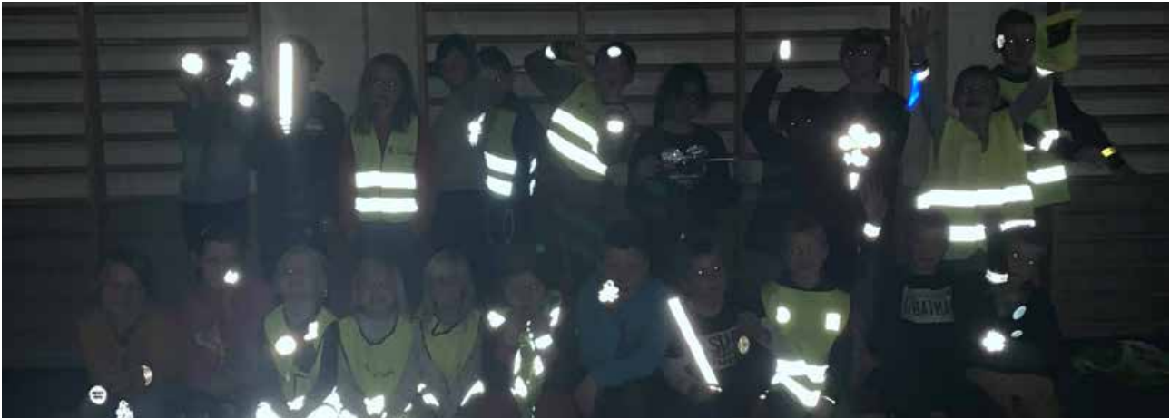
1. til 4. trinn på Kolbu skole har markert refleksdagen i grupper på tvers av trinnene. De har snakket om hvor viktig det er å bruke refleks, hatt fargeleggingsoppgaver og sett film om refleks.

Det kommer svært mange henvendelser fra foreldre, kommuner og Fylkesmannen angående «særlig farlig skolevei» i opplæringsloven § 7. Trygg Trafikks veileder om emnet er etterspurt, og den sendes ut til alle som ønsker den. Det gis mye veiledning over telefon. Trygg Trafikks rolle er å bistå kommuner og foreldre slik at relevante momenter blir vurdert før vedtak fattes.