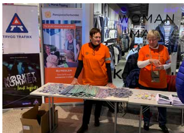
Refleksdagen – her med god hjelp fra pensjonistforbundet