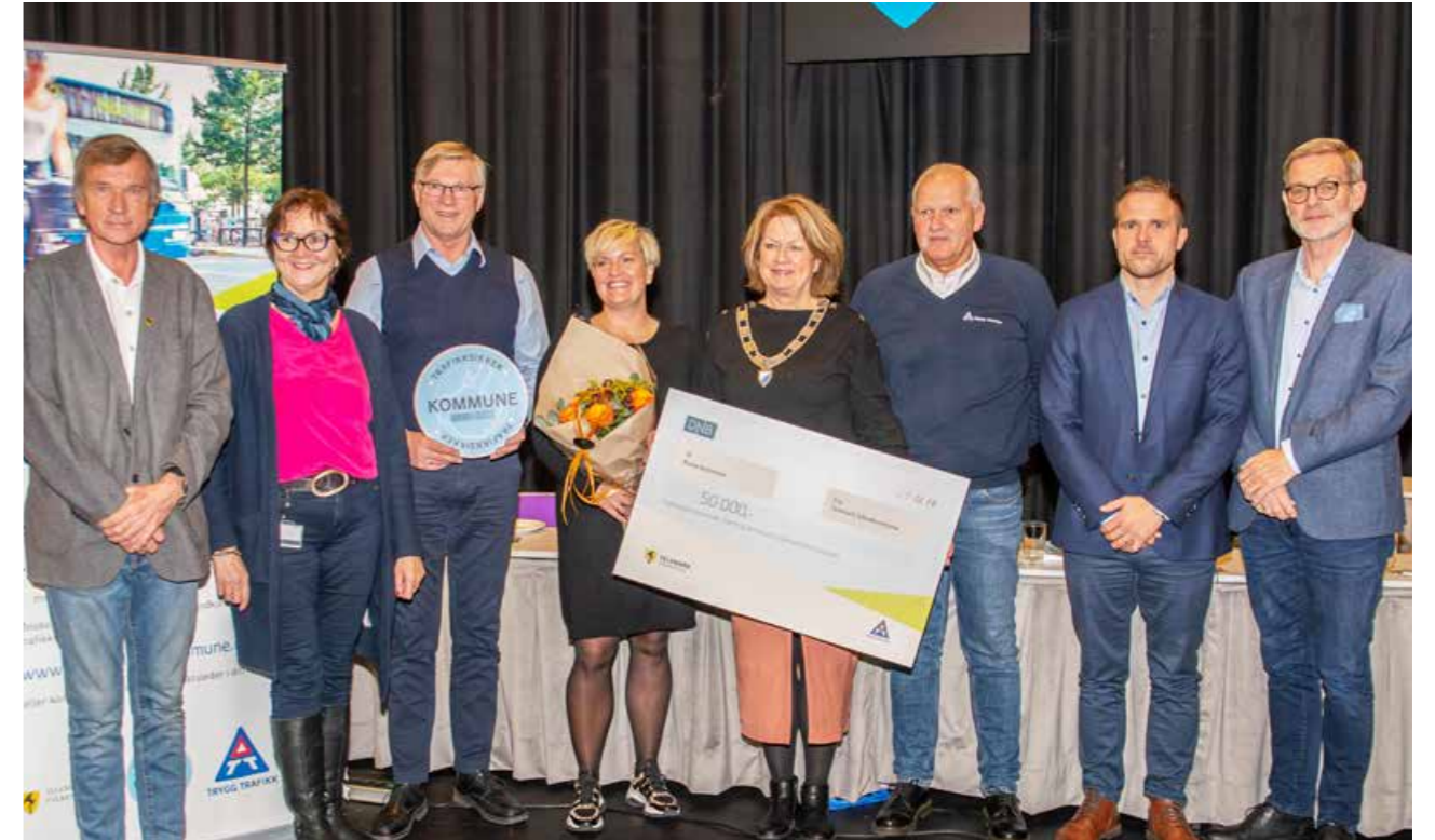
Nome kommune ble godkjent som trafiksikker kommune i oktober.

Det er forankret i Areal- og transportplan for Telemark 2015–2025 at Trygg Trafikks konsept Trafiksikker kommune skal inn i alle kommuner i Telemark innen planperioden er over. Arbeidet med Trafiksikker kommune lokalt går ut på å informere, inspirere og motivere kommuner til å bli godkjente trafiksikre kommuner. Det innledes først med et møte med ordfører og rådmann og rådmannens ledergruppe. Det skrives en intensjonsavtale der det framkommer en dato fram i tid for når kommunen går inn for å lande prosessen og fylle kriteriene for en endelig godkjenning fra Trygg Trafikk lokalt og sentralt. Trygg Trafikk i Telemark følger opp med veiledning og oppfølging i kommunen. I noen kommuner er det ønske om å informere kommunestyremøtet eller ha HMS-kurs eller barnehagekurs i denne prosessen – dette for å bevisstgjøre og øke kompetansen til deres medarbeidere og det politiske miljøet om trafiksikkerhet og hva det betyr å være en trafiksikker kommune der alle må bidra til å nå mål og redusere skade og død i trafikken. Til slutt er det godkjenningsmøte med kommunens administrative og politiske ledelse, der Trygg Trafikks sentrale representanter for konseptet gjennomgår enhet for enhet i kommunen opp mot kriteriene som de har svart ut. Eventuelt kommer det til uttrykk mulige forbedringspunkter.