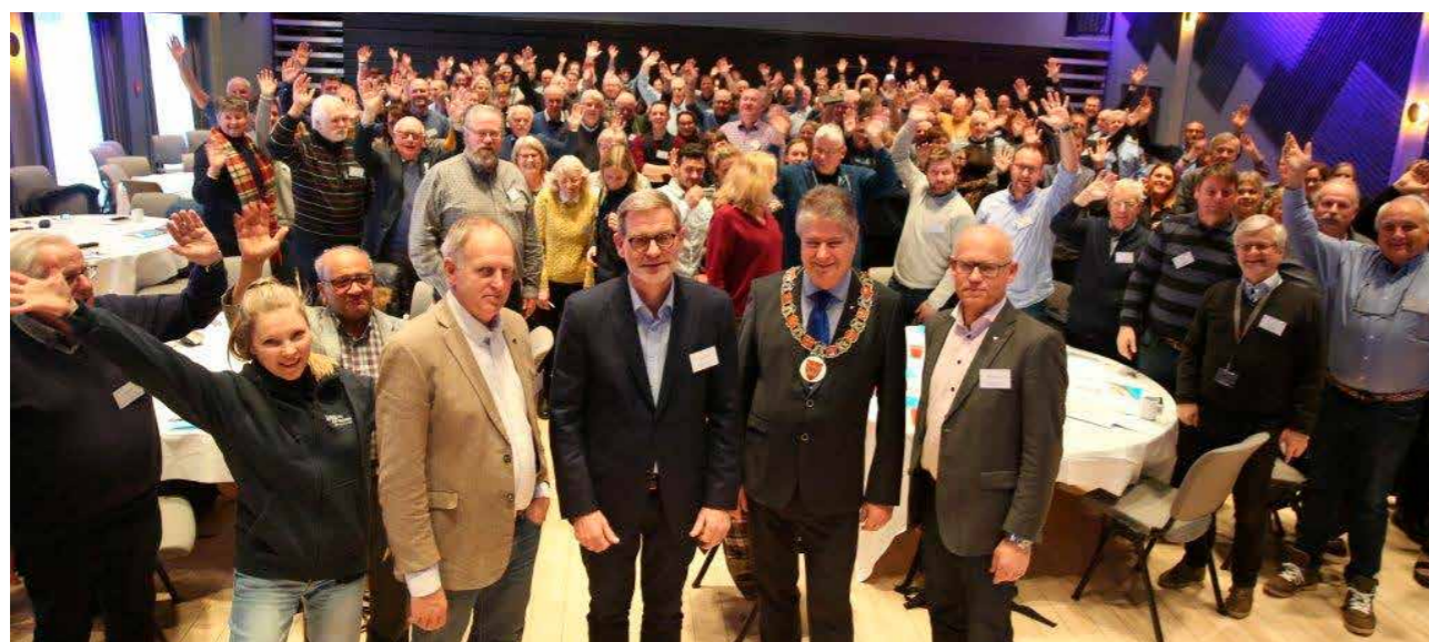
Historiens siste trafiksikker konferanse i BTV før regionreformen og fylkessammenlåingen fra 2020.

konferansen i Vrådal og på diverse andre møter i regi av Telemark fylkeskommune, samt Trygg Trafikks nasjonale trafiksikkerhetskonferanse «Nasjonale mål – regionalt ansvar.» Her trekkes linjene fra de nasjonale satsingsområdene til praktiske tiltak i fylkeskommunene og kommunene.