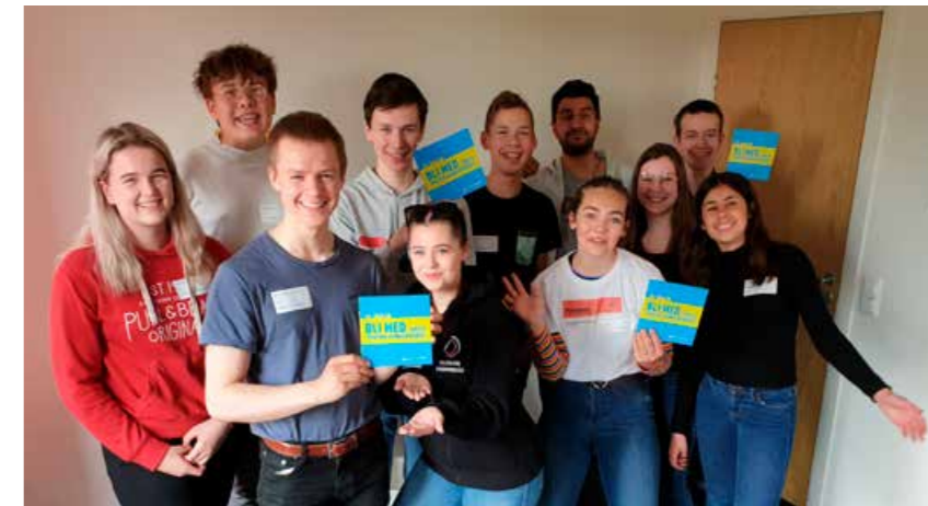
Ungdomsrådet forsøkte å få gjennomført #EDS i Telemark.