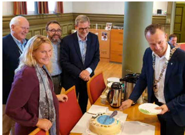
Skien kommune med sine 55.000 innbyggere ble godkjent som ts godkjent kommune i september. Dette ble feiret med kake.

Kommuner og fylkeskommuner har et viktig ansvar for innbyggernes trafiksikkerhet, blant annet som veieier, skoleeier og arbeidsgiver. Trafiksikkerhet er et tverrfaglig område, og samordning av arbeidet er en utfordring. Trafiksikker kommune og Trafiksikker fylkeskommune er godkjeningsordninger utviklet av Trygg Trafikk. Kriteriene bygger på eksisterende lovverk og er en hjelp for kommuner og fylkeskommuner til å systematisere trafiksikkerhetsarbeidet på tvers av sektorer. Folkehelsearbeidet er sentralt i kommuner og fylker, og det er naturlig å knytte trafiksikkerhet til det ulykkesforebyggende helsearbeidet.