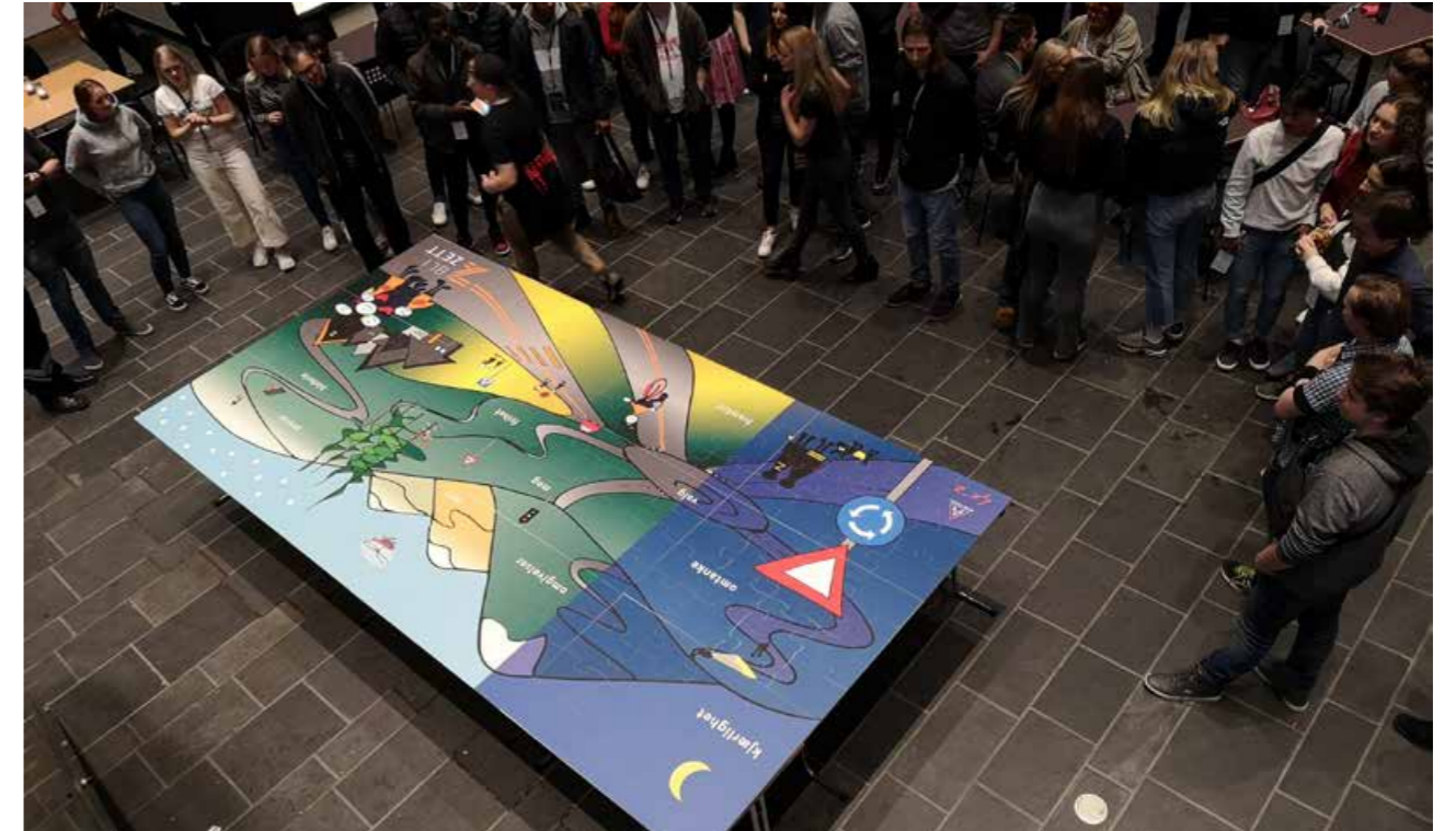
Puslespillet med tema trafikk på 2x4 meter. Dette ble lagt av de 200 deltakerne på BliZett konferansen. Dette henger nå på kjøpesenteret Arkaden i Skien og blir sett av mange.

tilskudd til henholdsvis Telemark og Vestfold, og aller helst at det blir en romsligere ramme, slik at vi kan opprettholde den store aktiviteten og aller helst får mulighet til å utvide den. Trygg Trafikk er gode til å bruke pengene «på bae siur» og få mye trafikksikkerhet ut av beskjedne midler.