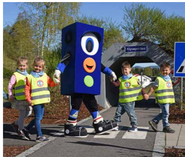
Lysen og barnehagebarn øver på kryssing i gangfelt.

Målgruppen for Barnas Trafikkklubb i dag er i hovedsak barnehager. Høsten 2017 kom trafikk inn som tema i rammeplanen for barnehager. Trygg Trafikk legger forholdene til rette og lager pedagogisk verktøy til formålet og legger dette nedlastbart på Barnas Trafikkklubbs nettsider. På den måten kan barnehagene melde seg inn, gjerne avdelingsvis, og laste ned gratis pedagogisk materiell til bruk i opplæringen. Vi vet at barnehagebarn liker å leke og lære om trafikk, for dette er noe de er en del av hver dag med familien. Vi har fremmet Barnas Trafikkklubb på Trafikkopplæringskurs for barnehageansatte, og ellers vært til stede på ulike arrangementer rundt om i Telemark, samt i