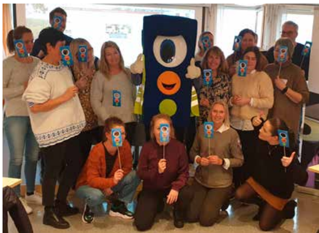
Trafikkopplæringskurs for barnehageansatte på Fylkeshuset i Skien.