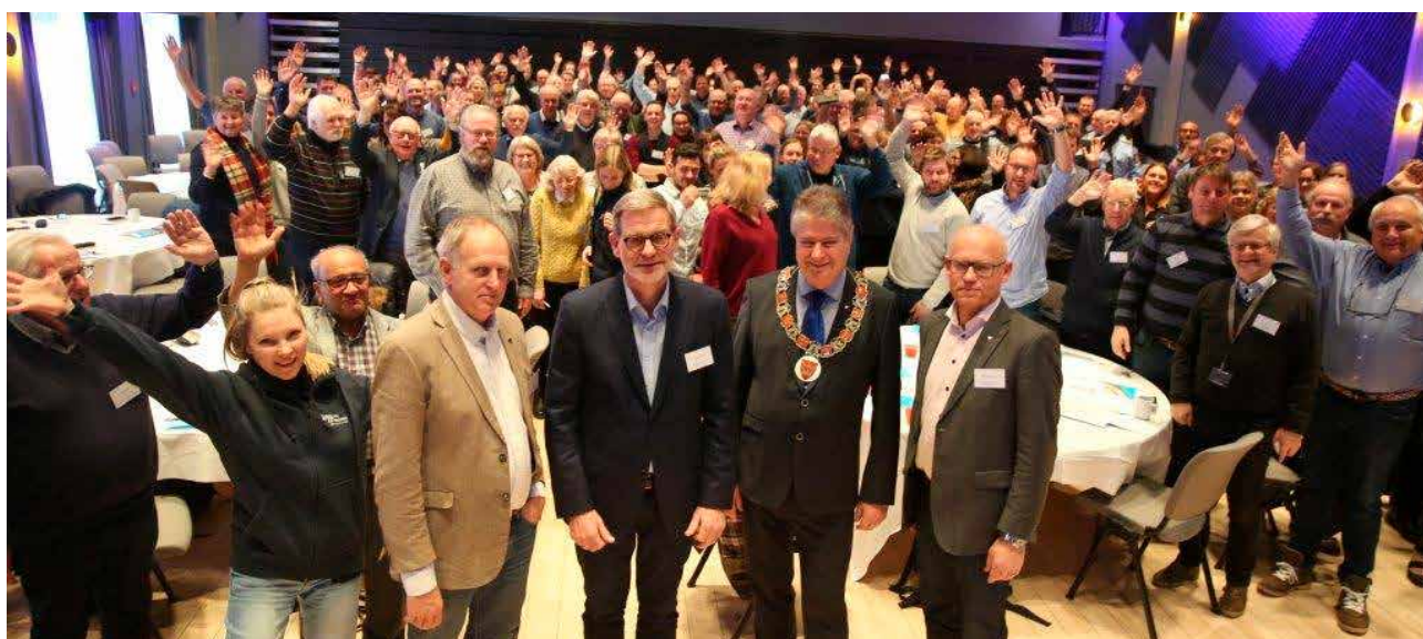
Historiens siste trafikkikker konferanse i BTV før regionreformen og fylkessammenslåingen fra 2020.

konferansen i Vrådal og på diverse andre møter i regi av Telemark fylkeskommune, samt Trygg Trafikks nasjonale trafikkikkerhetskonferanse «Nasjonale mål – regionalt ansvar.» Her trekkes linjene fra de nasjonale satsingsområdene til praktiske tiltak i fylkeskommunene og kommunene.