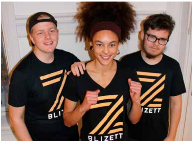
BliZett ambassadører fra Lyk-z & døtre stilte opp som gode hjelpere.