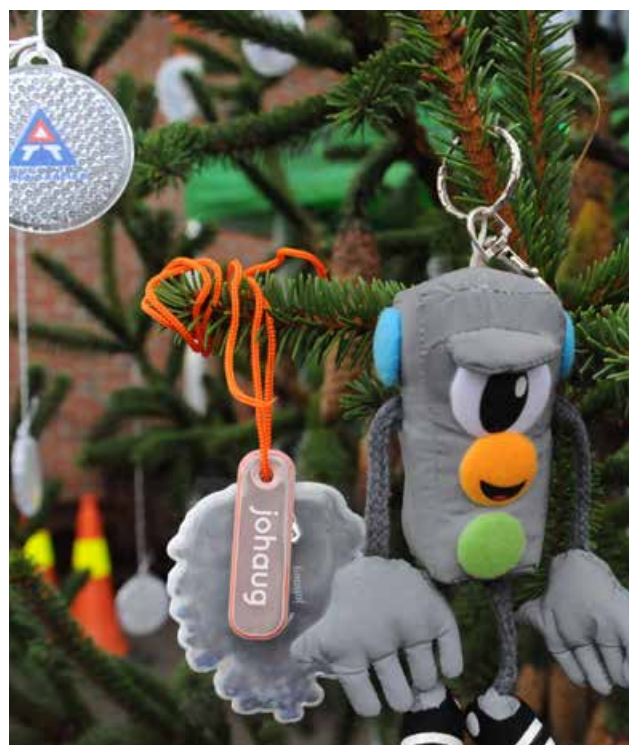
Telemark Skogselskap stilte opp på nasjonal refleksdag i Bø med grantre fullt av ekte kongler, og som ble pyntet med reflekskongler designet av Therese Johaug, og andre reflekser.

Målgruppen for refleksdagen er alle trafikanter, men spesielt voksne over 20 år er en viktig målgruppe fordi de er dårlige refleksbrukere, og de er rollemodeller og forbilder for mange. Det ble delt ut tusenvis av reflekser. Flere organisasjoner og skoler har meldt om at de arrangerer egne refleksaktiviteter knyttet til refleksdagen eller hele refleksdagsuken. I tilknytning til Refleksdagen 2019 innledet vi samarbeid med blant annet Telemark Skogselskap, Telemark Bondelag, Bø Bygdekvinne lag og Fylkeshuset i Skien. I Bø var vi representert utenfor Bø senteret, der Telemark Skogselskap, Telemark Bondelag og Bø Bygdekvinne lag lagde en flott stand med en grantre topp fylt av kongler og med konglere reflekser festet på, sekker med grankongler, traktor med lys som lyste opp refleksene på grantre toppen, og flotte rosemalte sendingskurver med konglere reflekser til Therese Johaug. Dette var et populært