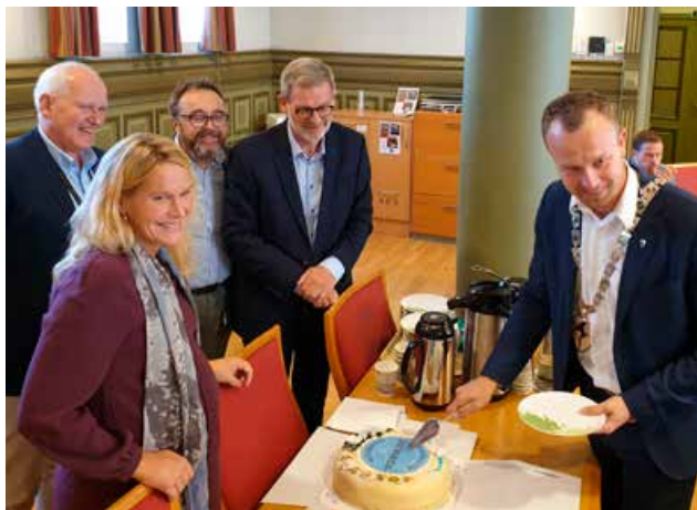
Skien kommune med sine 55.000 innbyggere ble godkjent som ts godkjent kommune i september. Dette ble feiret med kake.

Kommuner og fylkeskommuner har et viktig ansvar for innbyggernes trafikkssikkerhet, blant annet som veieier, skoleeier og arbeidsgiver. Trafikkssikkerhet er et tverrfaglig område, og samordning av arbeidet er en utfordring. Trafikkssikker kommune og Trafikkssikker fylkeskommune er godkjenningsordninger utviklet av Trygg Trafikk. Kriteriene bygger på eksisterende lovverk og er en hjelp for kommuner og fylkeskommuner til å systematisere trafikkssikkerhetsarbeidet på tvers av sektorer. Folkehelsearbeidet er sentralt i kommuner og fylker, og det er naturlig å knytte trafikkssikkerhet til det ulykkesforebyggende helsearbeidet.