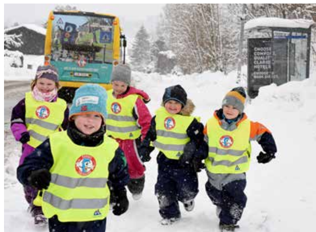
Glade barn i Barnas Trafikkklubb.

møte med kommuner i forbindelse med Trafikk-sikker kommune-konseptet og gjennom FTU-møter i kommunene. Dette har ført til mer kunnskap om Trygg Trafikk og Barnas Trafikkklubb sine tilbud til barnehager. Det er 165 medlemmer fra Telemark i Barnas Trafikkklubb per 1. januar 2020.