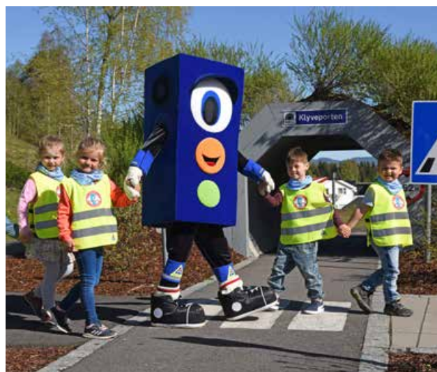
Lyset og barnehagebarn øver på kryssing i gangfelt.

Målgruppen for Barnas Trafikkklubb i dag er i hovedsak barnehager. Høsten 2017 kom trafikk inn som tema i rammeplanen for barnehager. Trygg Trafikk legger forholdene til rette og lager pedagogisk verktøy til formålet og legger dette nedlastbart på Barnas Trafikkklubbs nettsider. På den måten kan barnehagene melde seg inn, gjerne avdelingsvis, og laste ned gratis pedagogisk materiell til bruk i opplæringen. Vi vet at barnehagebarn liker å leke og lære om trafikk, for dette er noe de er en del av hver dag med familien. Vi har fremmet Barnas Trafikkklubb på Trafikkopplæringskurs for barnehageansatte, og ellers vært til stede på ulike arrangementer rundt om i Telemark, samt i