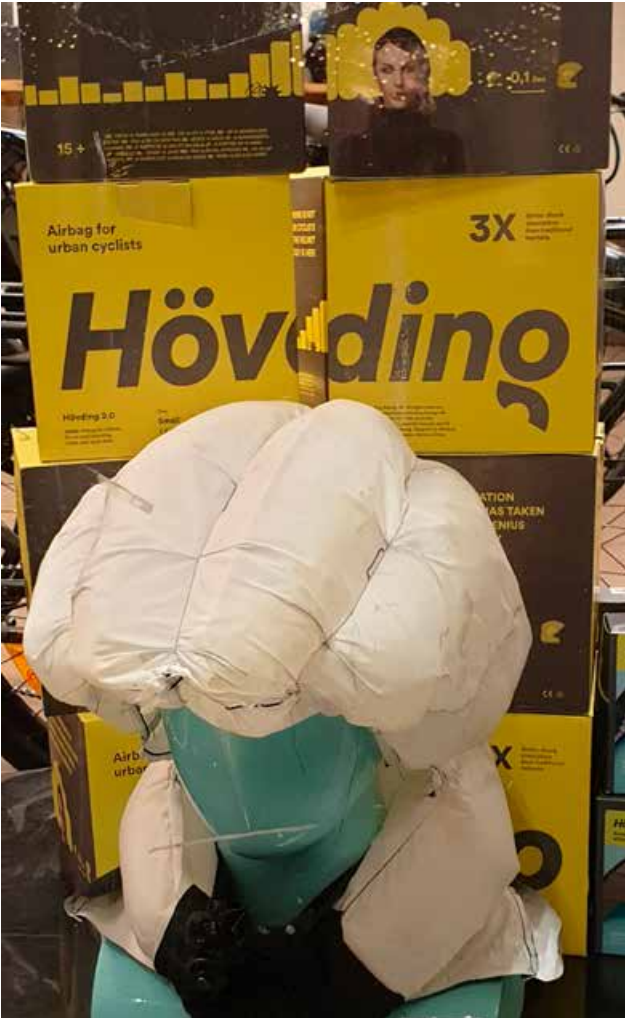
Høvedinghjelm er et godt alternativ for de som ikke vil bruke vanlig sykkelhjelm.