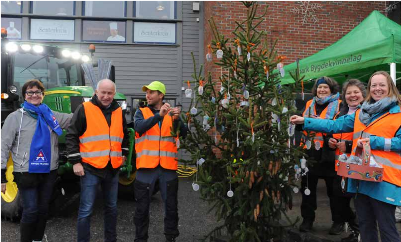
Telemark Skogselskap, Telemark Bondelag og Telemark Bygdekvinne lag stilte opp med refleksstand tilpasset årets refleksdesign, konge av Therese Johaug.

innslag en mørk og regntung ettermiddag på den nasjonale Refleksdagen i oktober. Det ble folksomt og mye prat om betydningen av refleksbruk med publikum, og det ble delt ut mange reflekser. Bø Blad stilte opp og lagde reportasje.