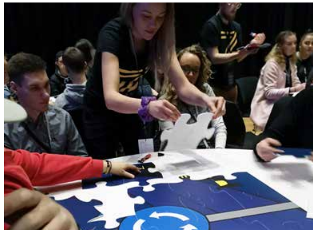
Deltakerne på BliZett puslet sammen med de andre på konferansen et 2x4 meter stort puslespill.

press på seg på mange ulike måter. Ungdom mellom 15 og 24 år er en svært risikoutsatt gruppe, og vi må sørge for å sette dem i stand til å ta vare på seg selv og de rundt seg – lære dem å se konsekvenser av valg.