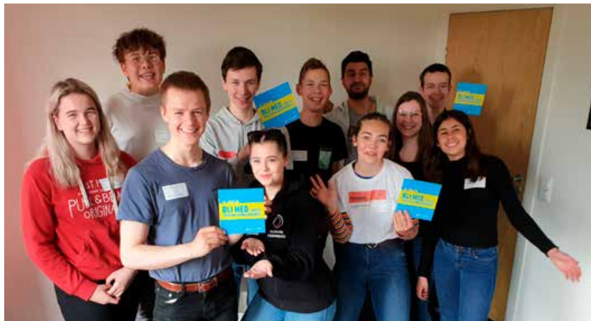
Ungdomsrådet forsøkte å få gjennomført #EDS i Telemark.