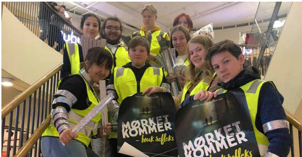
Som tidligere år: Elever fra Trafikk valgfag ved Finnsnes ungdomsskole aksjonerte i sentrum på årets refleksdag.