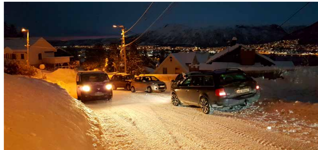
Trafikk-kaos om morgenen ved barnehage på Tromsøya.