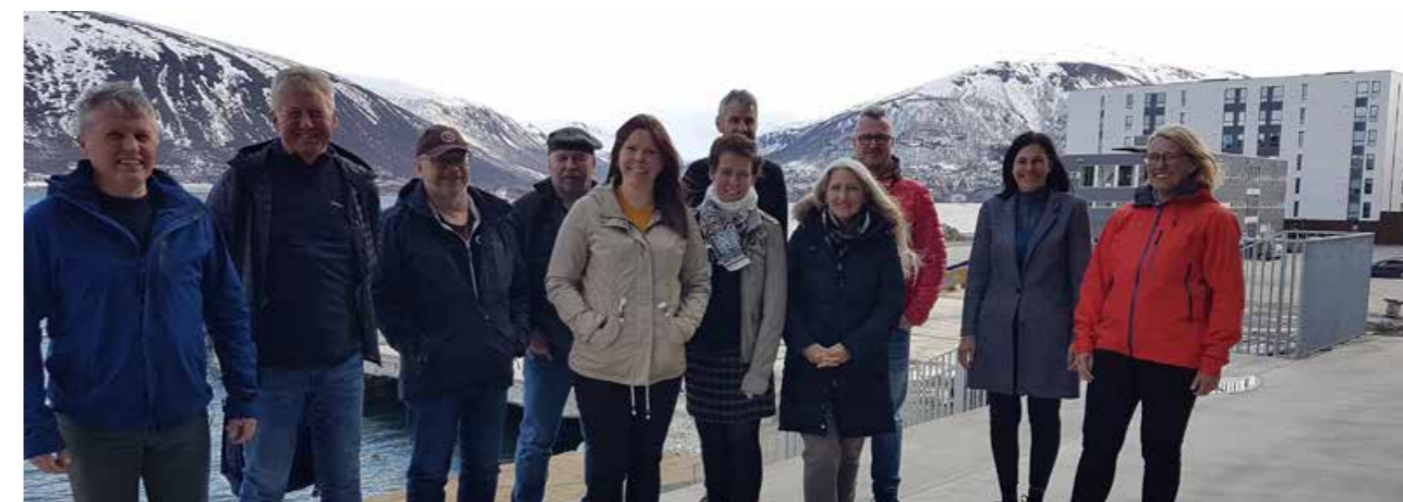
Nettverksmøte for lærere i Trafikk valgfag i mai. Deltakere fra sør-, midt- og nord i fylket.

Nettverksmøte for lærere som underviser i valgfag trafikk, ble gjennomført i Tromsø i mai. Tilbudet ble sendt både til Troms og Finnmark. Hovedtema dette året var: Trafikalt grunnkurs i valgfaget.