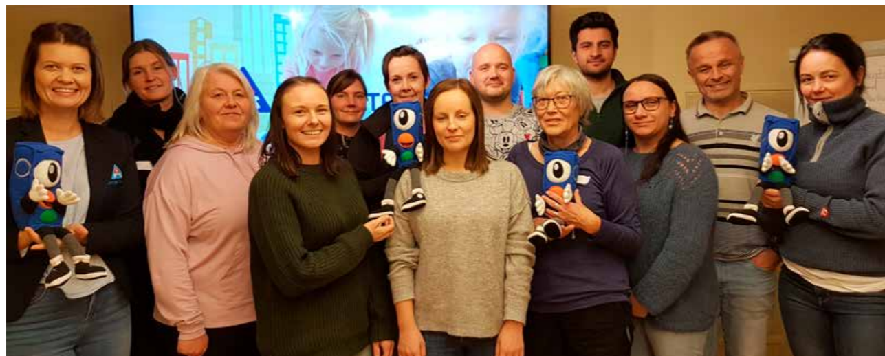
Kurs for ansatte i barnehager i Nord-Troms i september.

TT Troms inviterte til sykkelkurs på Finnsnes (for lærere), men måtte avlyse på grunn av kun fire påmeldte.