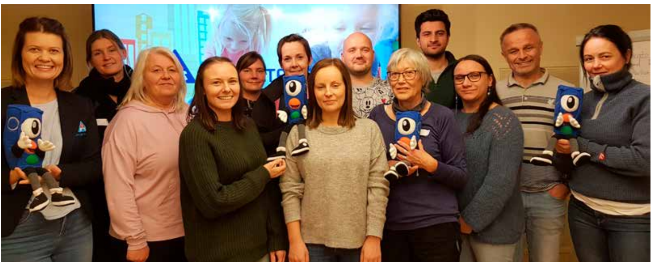
Kurs for ansatte i barnehager i Nord-Troms i september.

TT Troms inviterte til sykkelkurs på Finnsnes (for lærere), men måtte avlyse på grunn av kun fire påmeldte.