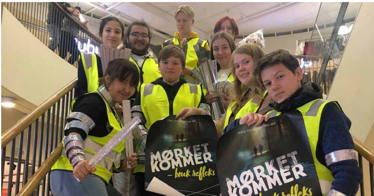
Som tidligere år: Elever fra Trafikk valgfag ved Finnsnes ungdomsskole aksjonerte i sentrum på årets refleksdag.