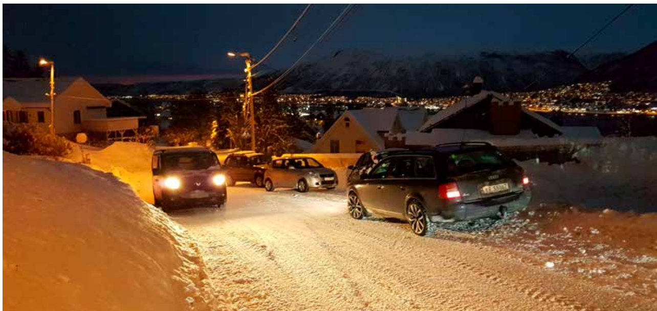
Trafikk-kaos om morgenen ved barnehage på Tromsøya.