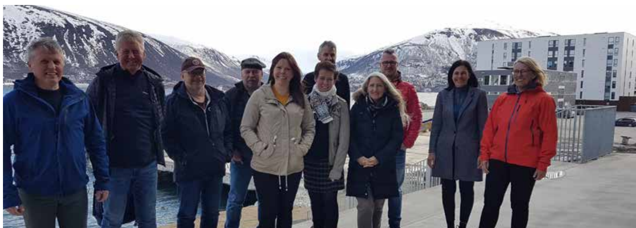
Nettverksmøte for lærere i Trafikk valgfag i mai. Deltakere fra sør-, midt- og nord i fylket.

Nettverksmøte for lærere som underviser i valgfag trafikk, ble gjennomført i Tromsø i mai. Tilbudet ble sendt både til Troms og Finnmark. Hovedtema dette året var: Trafikalt grunnkurs i valgfaget.